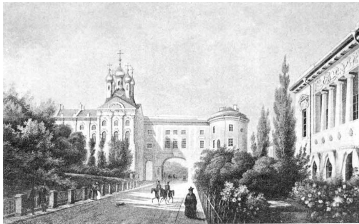
ЛИЦЕЙ И ДИРЕКТОРСКИЙ ДОМЪ.

Когда Александру Сергеевичу исполнилось 12 лет, его отдали учиться в лицей в Царское село, это недалеко от Петербурга. В этом лицее учились только способные дети знаменитых семей. В лицее он проучился 6 лет. Там у него появилось много друзей. В лицее он начал писать стихи, которые были посвящены друзьям, близким, много стихов написано о природе.