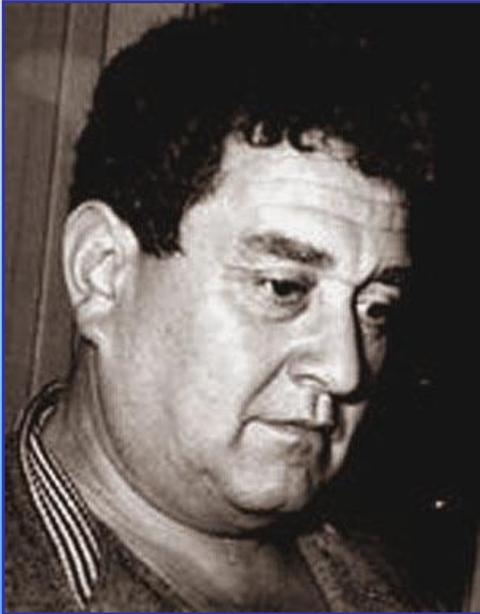
Виктор Юзефович Драгунский (1913-1972гг)