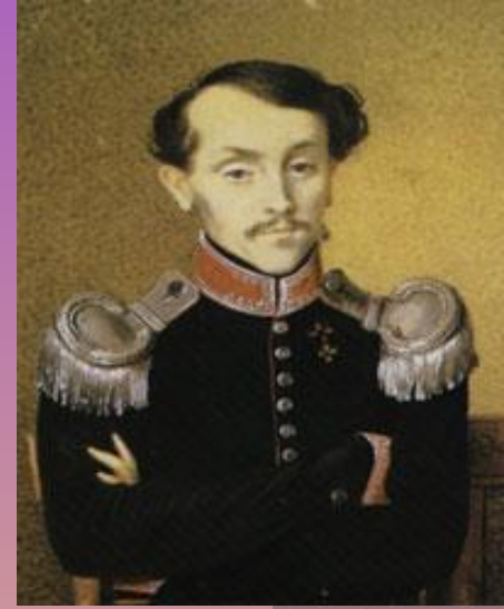
Николай Ильич Толстой - отец Л.Н. Толстого.