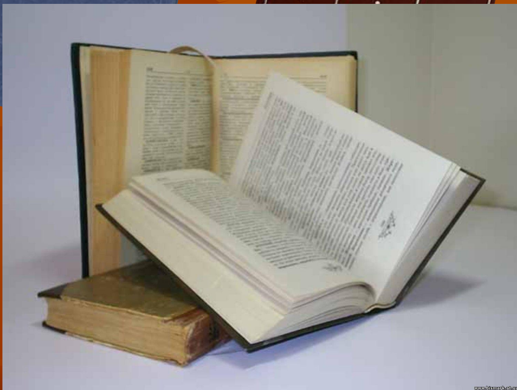
Алексей Николаевич Толстой

“Москве угрожает враг”, “Что мы защищаем”, “Русские воины”, “Разгневанная Россия”, “Родина”.