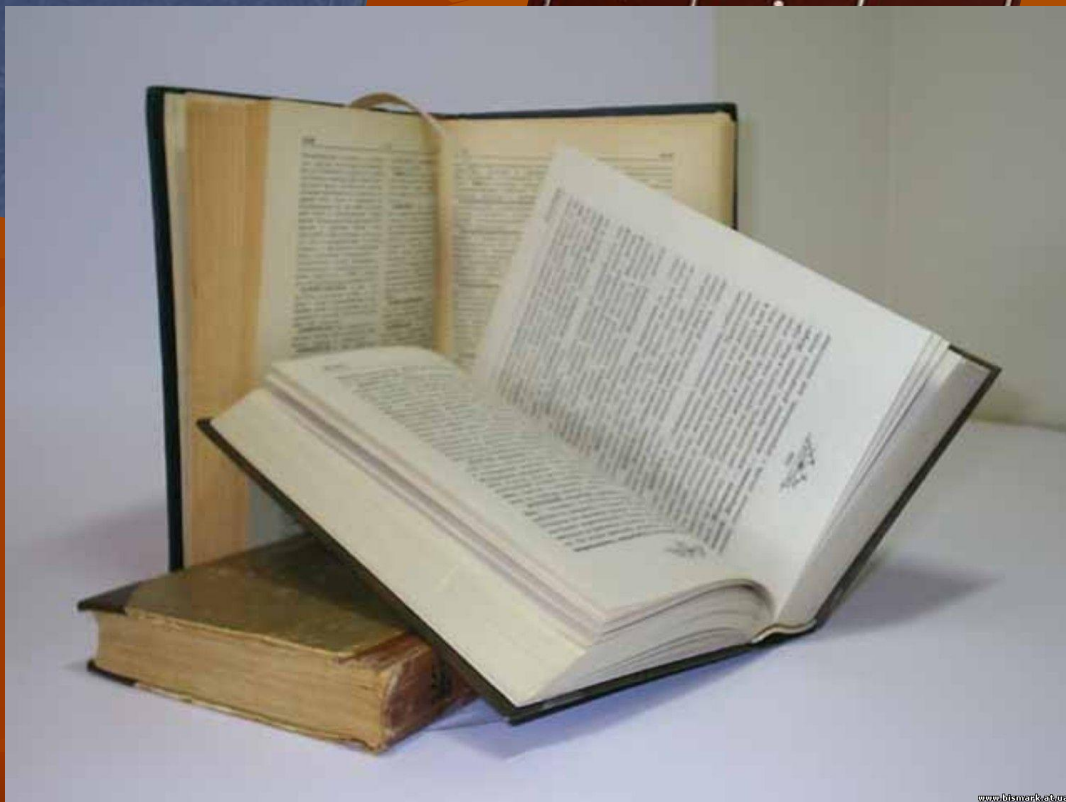
Алексей Николаевич Толстой

“Москве угрожает враг”, “Что мы защищаем”, “Русские воины”, “Разгневанная Россия”, “Родина”.