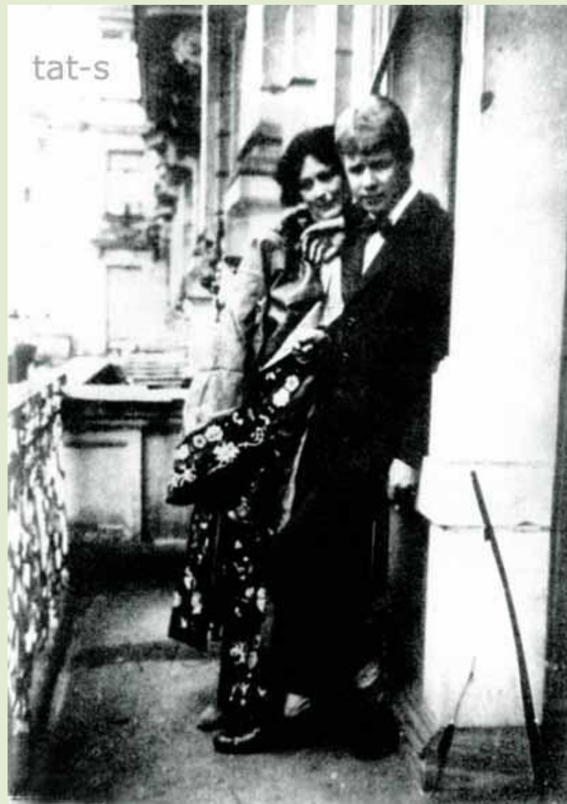
Сергей Есенин и Айседора Дункан, на улицах Венеции. Фото - август 1922 год.