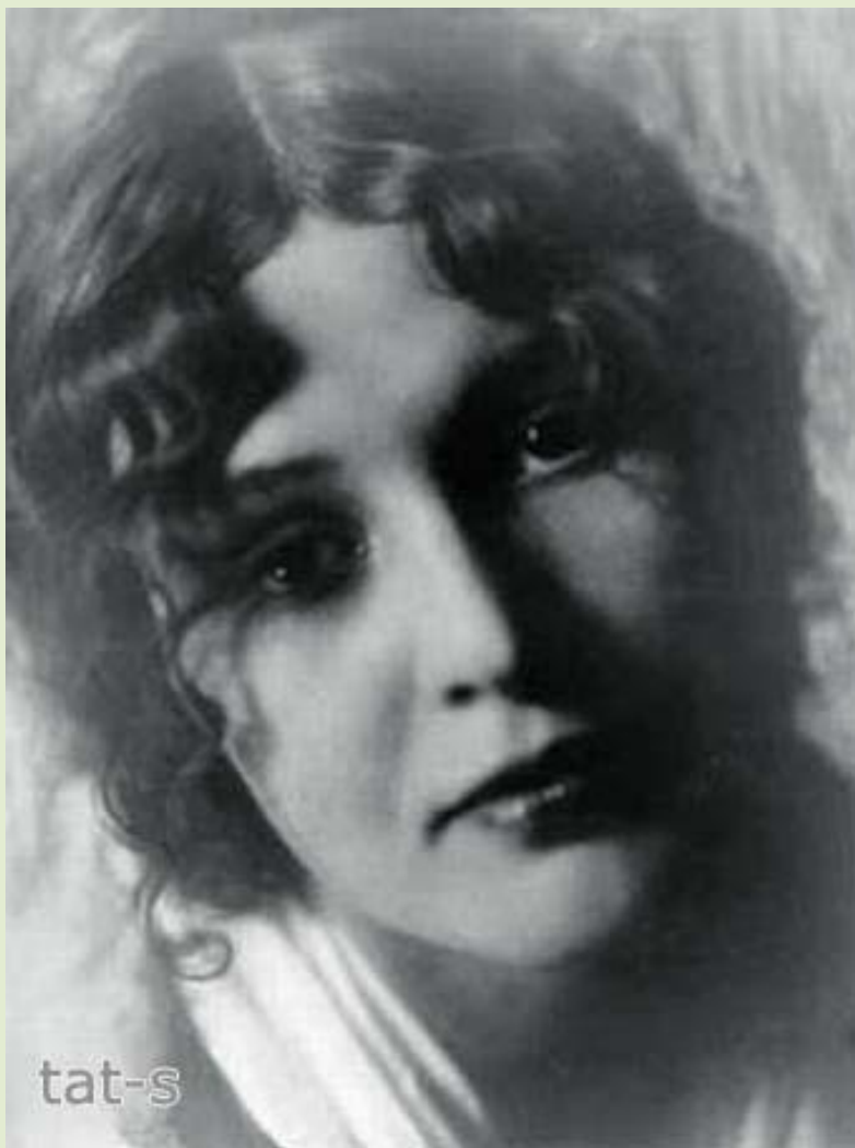
Жена Есенина, актриса - Зинаида Николаевна Райх (1894 - 1939)

30 июля 1917 года Есенин (21 год) обвенчался актрисой Зинаидой Райх в церкви Кирика и Улиты Вологодского уезда.