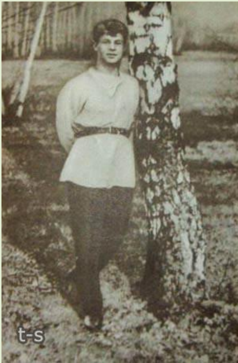
Сергей Есенин у березы. Фото - 1918 год.

В начале 1918 Есенин переезжает в Москву. С воодушевлением встретив революцию, он пишет несколько небольших поэм ("Иорданская голубица", "Инония", "Небесный барабанщик", все 1918, и др.), проникнутых радостным предчувствием "преображения" жизни. Богоборческие настроения сочетаются в них с библейской образностью для обозначения масштаба и значимости происходящих событий. Есенин воспевая новую действительность и ее героев пытался соответствовать времени ("Кантата", 1919). В более поздние годы им были написаны "Песнь о великом походе", 1924, "Капитан земли", 1925, и др.). Размышляя, "куда несет нас рок событий", поэт обращается к истории (драматическая поэма "Пугачев", 1921).