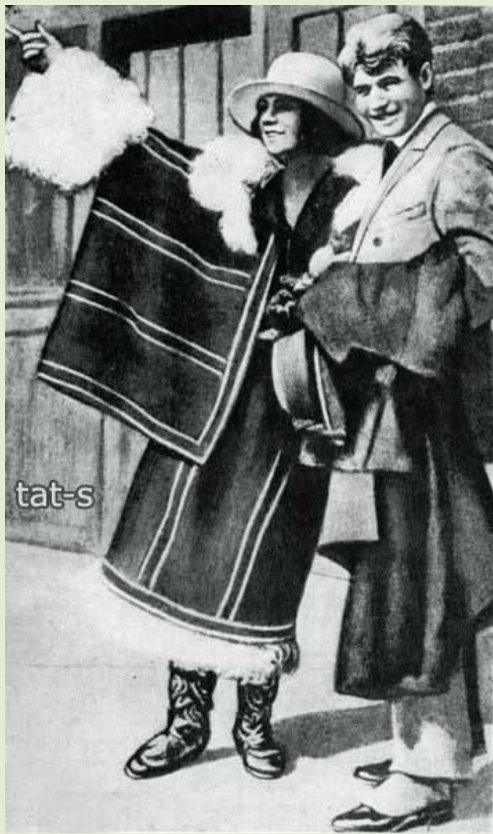
Сергей Есенин и Айседора Дункан на пароходе "Paris". Фото (3) - 1 октября 1922 год