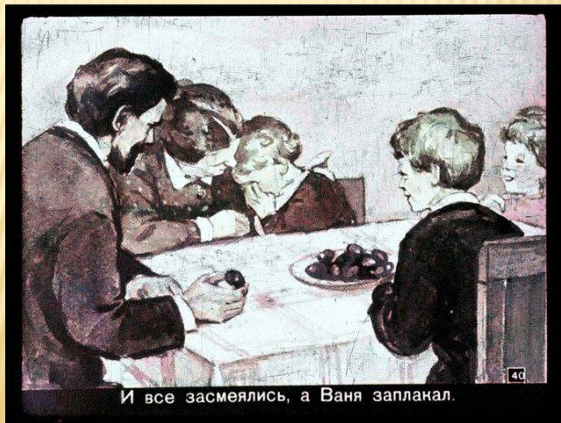
И все засмеялись, а Ваня заплакал.

Тайна в этом рассказе живет, Попробуй её разгадать, Лишь тот секрет рассказа найдёт, Кто сможет Ваню понять.