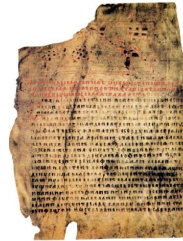
Фрагмент рукописной Лаврентьевско й летописи