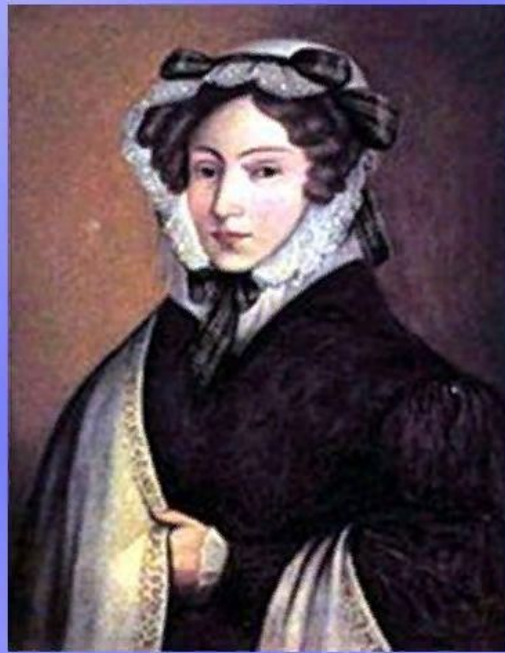
Мать писателя. М.И. Гоголь - Яновская