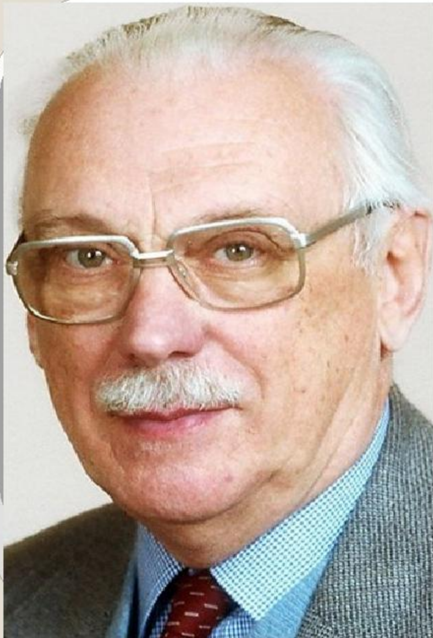
Сергей Владимирович Михалков (1913-2009)