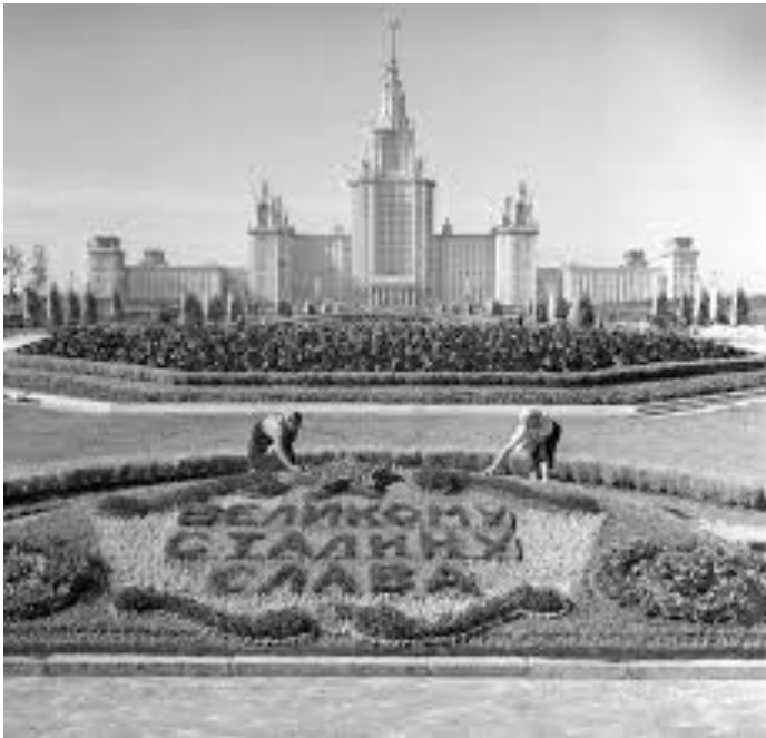
Московский Государственный Университет

Ему не приходилось искать себя и свою тему. Его поэтический мир с самого начала был резко очерчен. Майоров увидел как бы со стороны самого себя и поколение, к которому принадлежал.