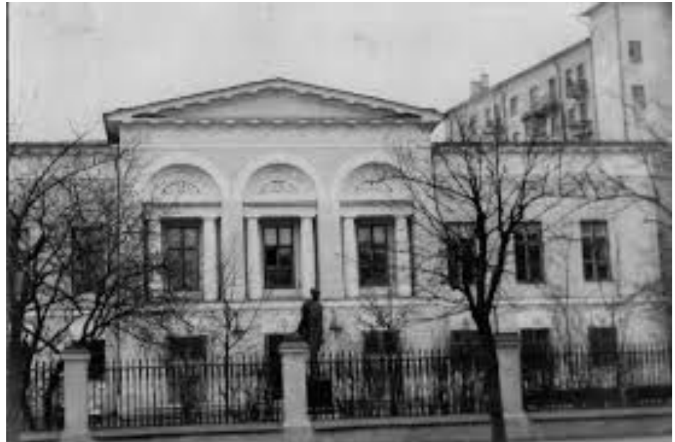
Литературный институт имени А.М. Горького