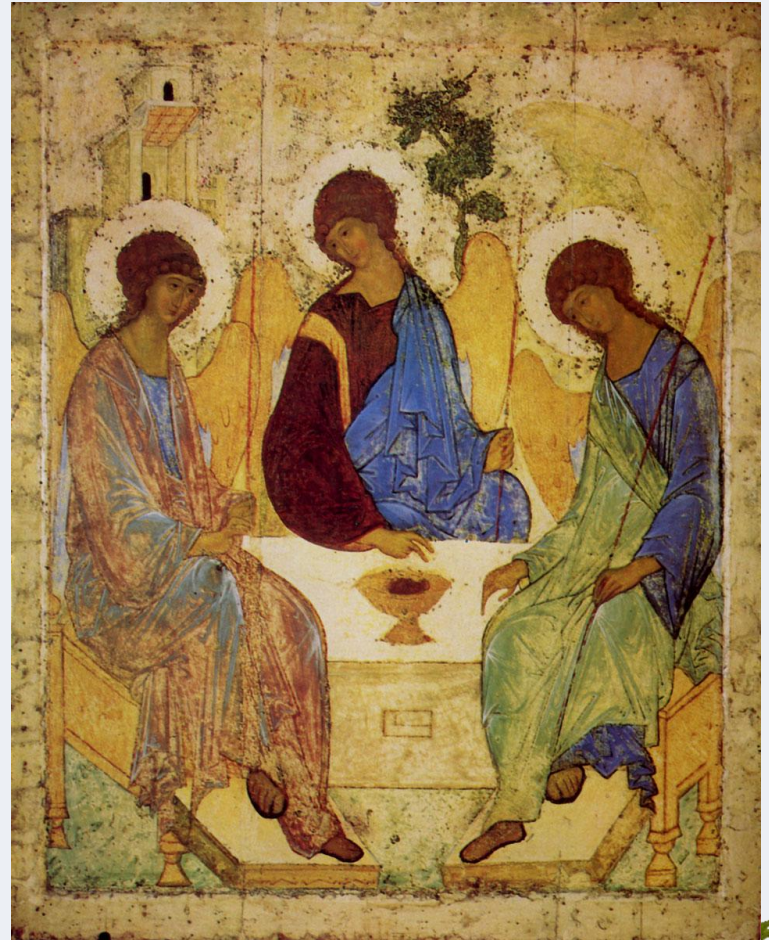
Андрей Рублев. Троица

Мы соотнесли красочную гамму его любимых цветов (голубой, синий, малиновый, золотой) с палитрой древнерусской живописи: синева и «золото» в поэзии С. Есенина напоминают древнюю фресковую живопись.