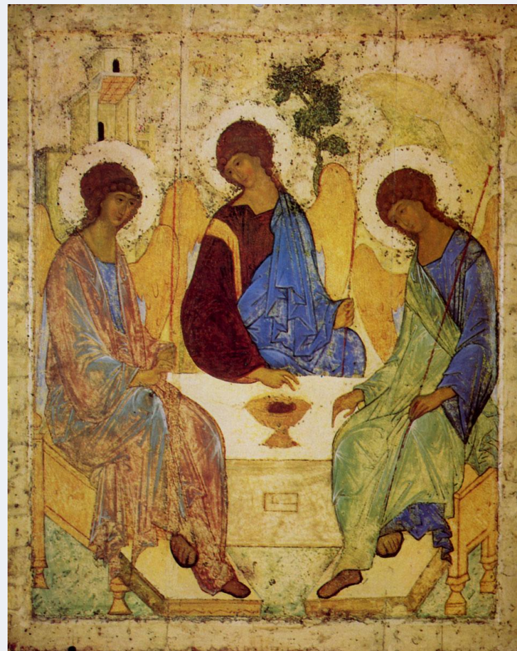
Андрей Рублев. Троица

Мы соотнесли красочную гамму его любимых цветов (голубой, синий, малиновый, золотой) с палитрой древнерусской живописи: синева и «золото» в поэзии С. Есенина напоминают древнюю фресковую живопись.