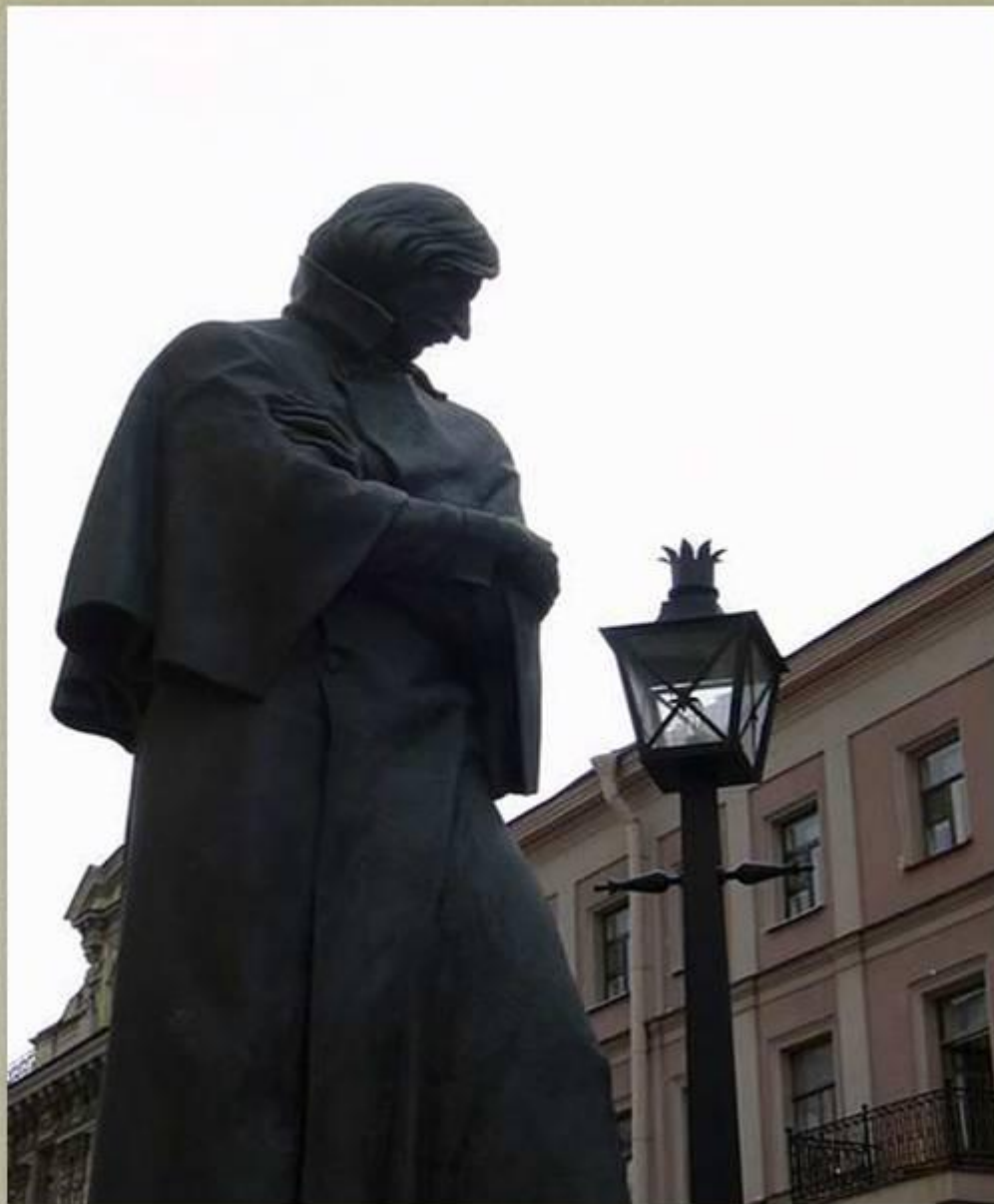
Памятник Н.В.Гоголю в Санкт-Петербурге