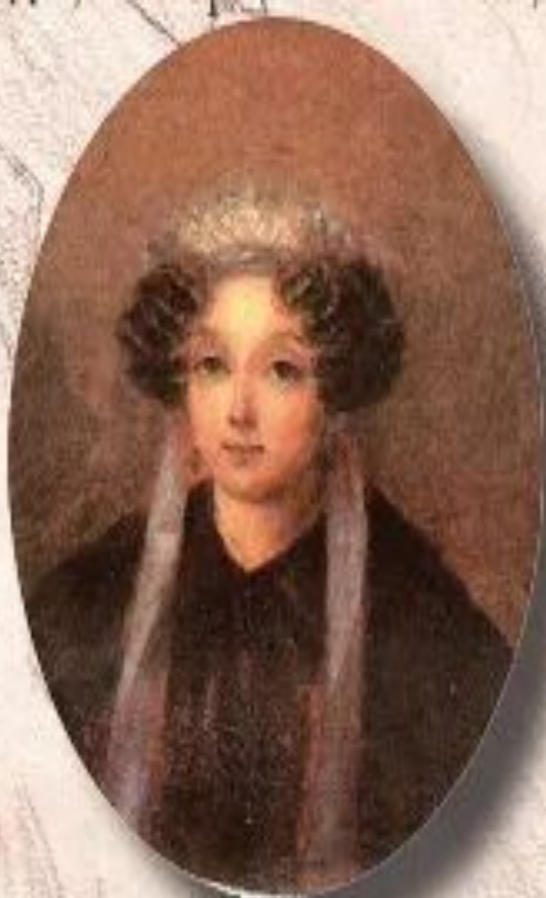
Мать Н.В. Гоголя