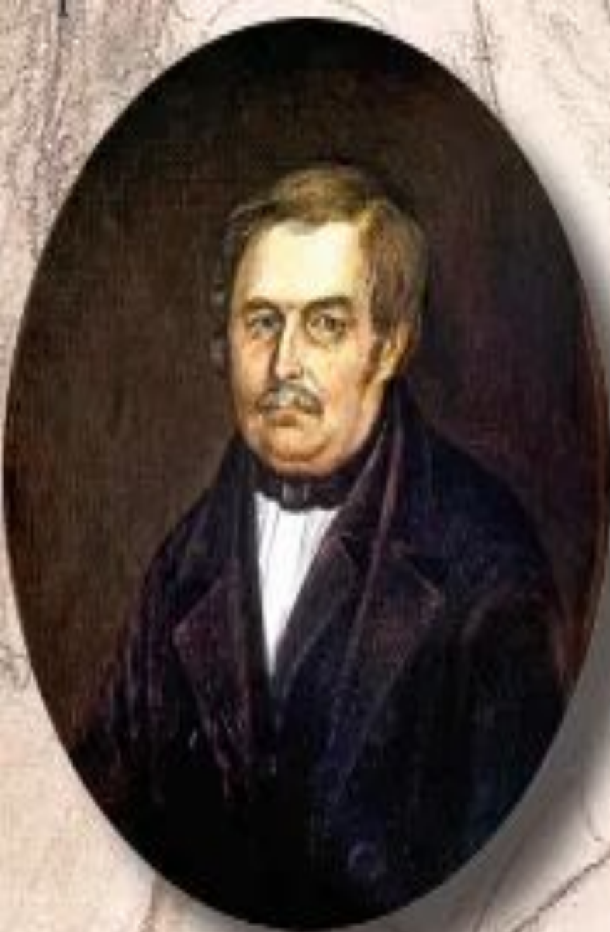
Отец Н.В. Гоголя