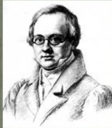
Антон Антонович Дельвиг