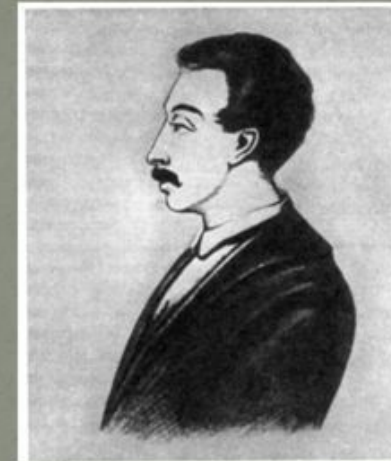
Вильгельм Карлович Кюхельбекер