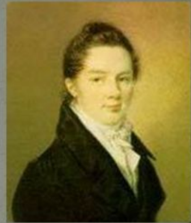
Иван Иванович Пущин