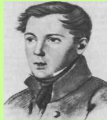
Ф. Ф. МАТЮШКИН. Рисунок неизвестного художника. 1816—1817.