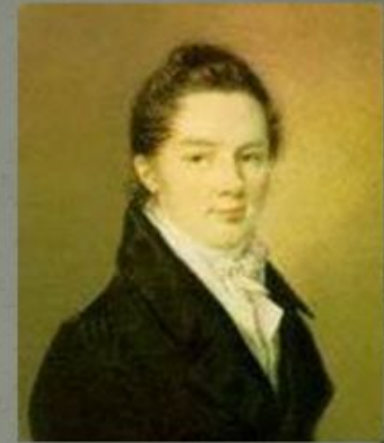
Иван Иванович Пущин