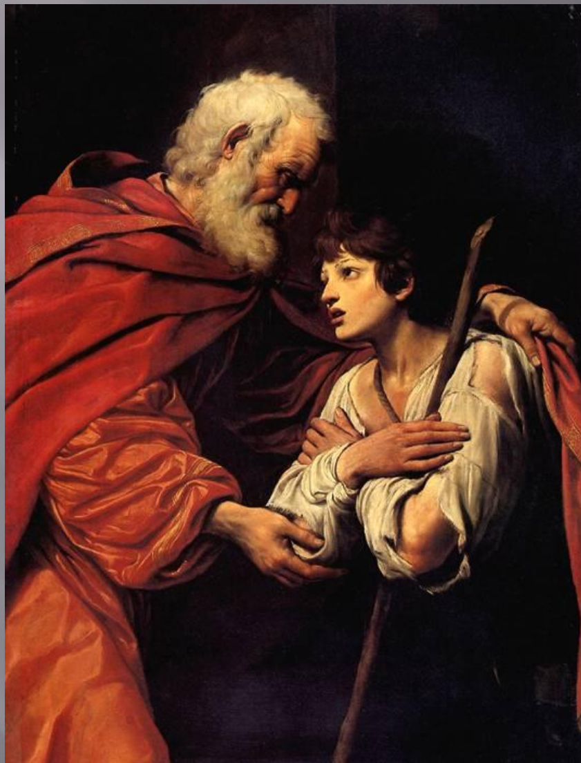
Лувр. СПАДА ЛИОНЕЛЛО Возвращение блудного сына.