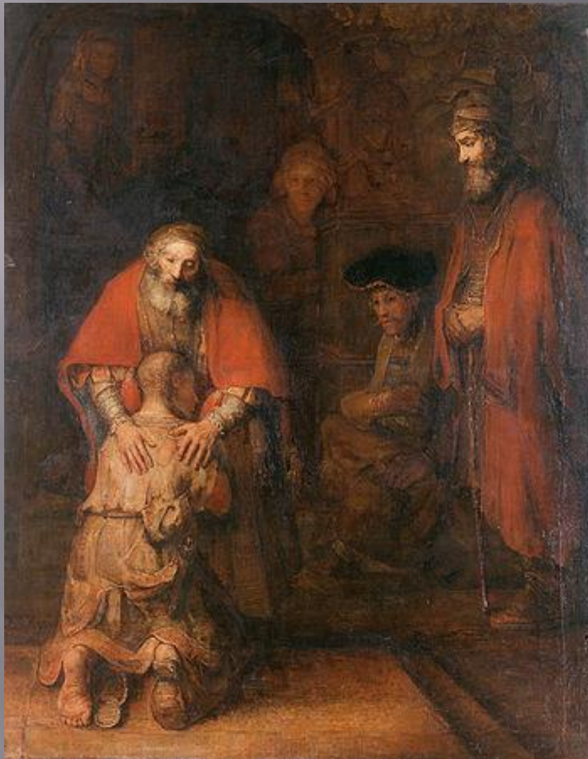
Рембрандт. Возвращение блудного сына. Эрмитаж. Санкт-Петербург