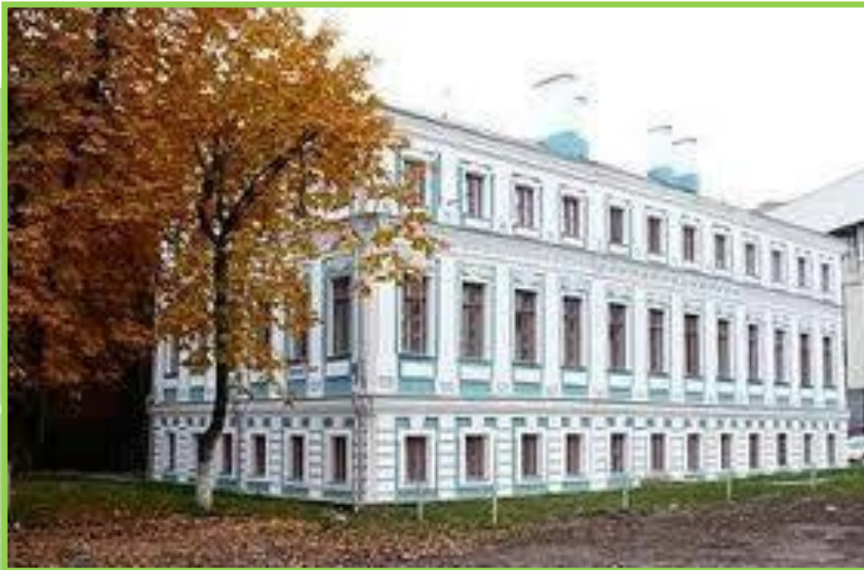
Дом-музей И. Никитина в Воронеже

Иван Саввич Никитин родился 21 сентября 1824 года в Воронеже. Отец его был торговцем - владел свечным заводом и лавкой.