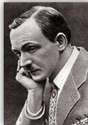
Янка Купала 1882-1942