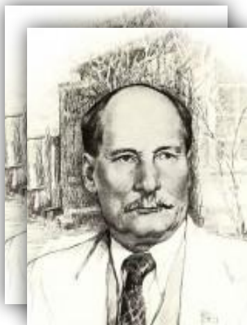
Якуб Колас 1882-1956