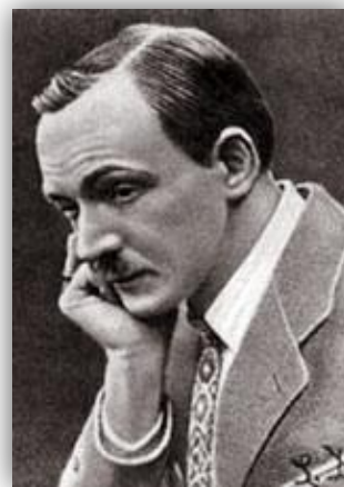
Янка Купала 1882-1942