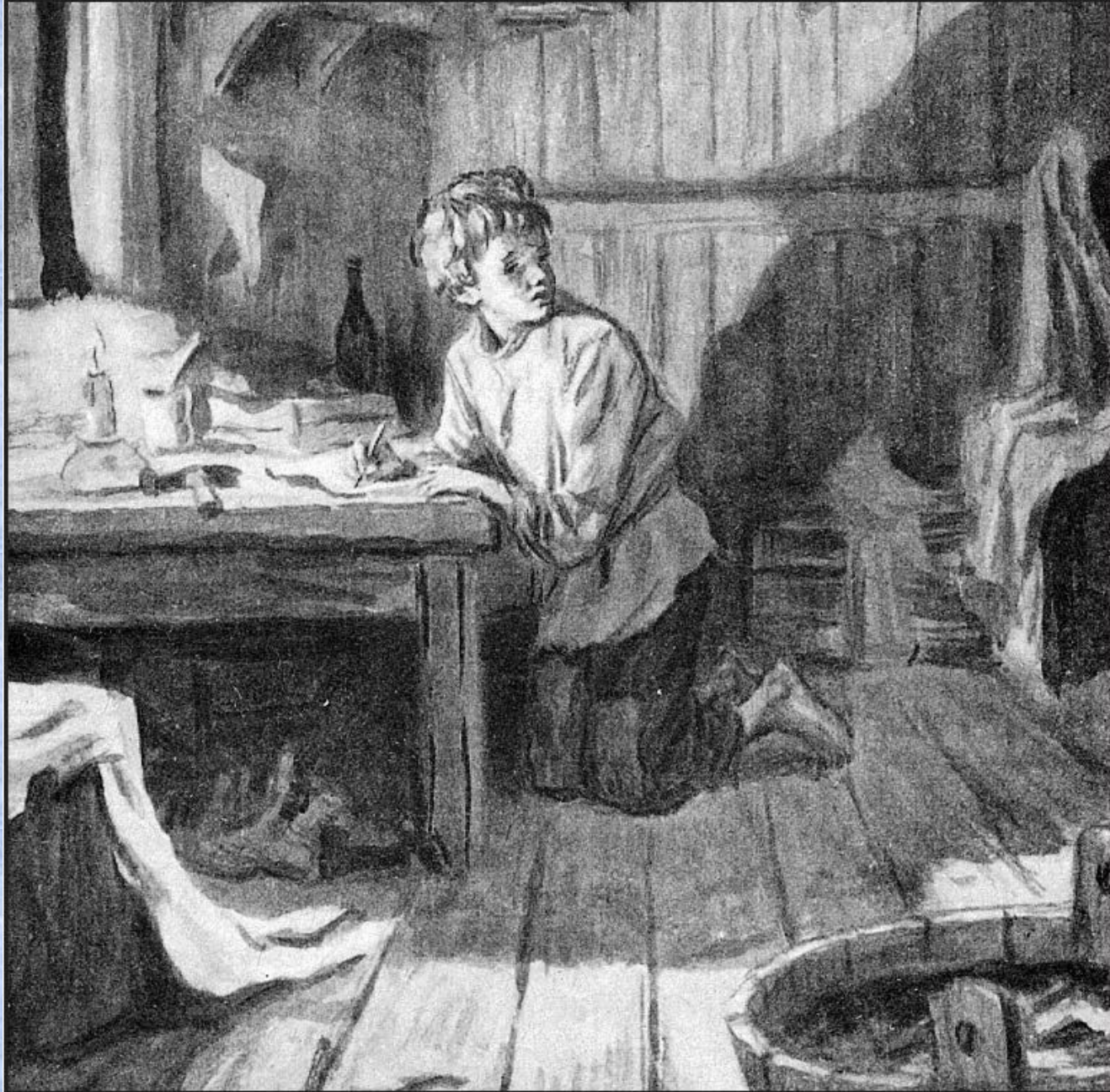
Иллюстрация к рассказу А.П. Чехова «Ванька». Художник Т. Гапоненко