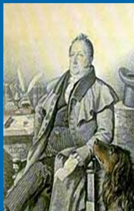
➤ Отец, Сергей Львович Пушкин (1770- 1838г.)

В семье, кроме Александра Сергеевича было еще несколько детей – сын Лев и дочь Ольга. С 1805 по 1810 год Пушкин проводил много времени (особенно летом) у своей бабушки в подмосковном селе Захарове. Именно бабушка наняла Арину Родионовну Яковлеву, няню, которую так полюбил юный Пушкин.