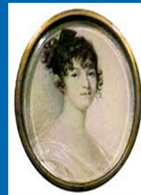
Мать, Надежда Осиповна Пушкина (1775- 1836г.)