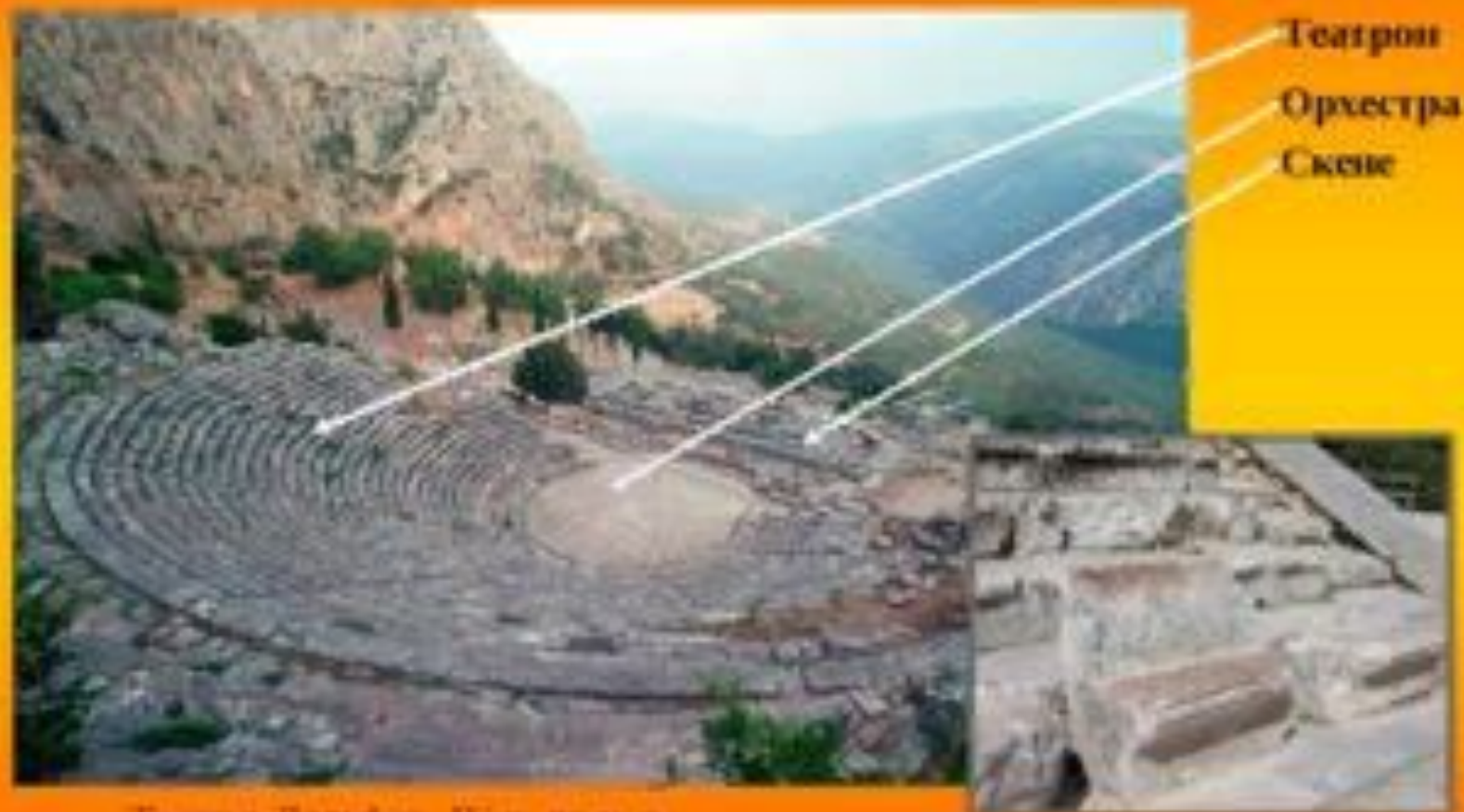
Театр в Дельфах, IV в. до н. э.