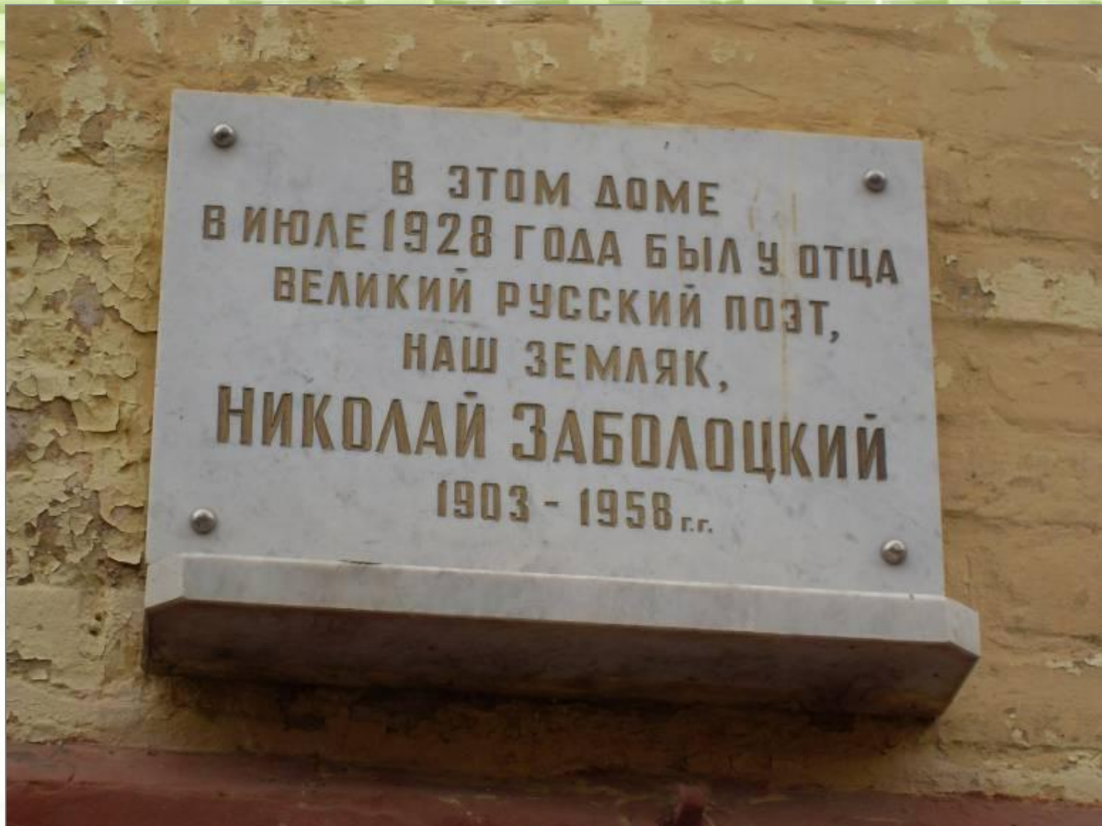
Мемориальная доска в городе Кирове