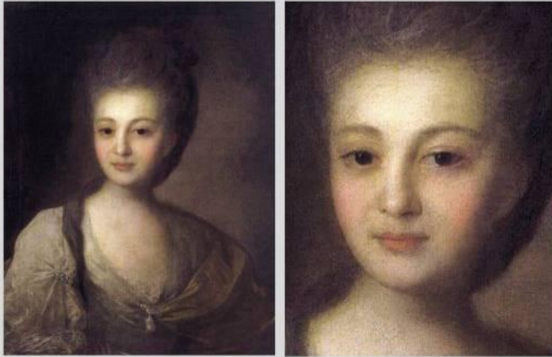
Федор Рокотов. Портрет Александры Струйской. 1772