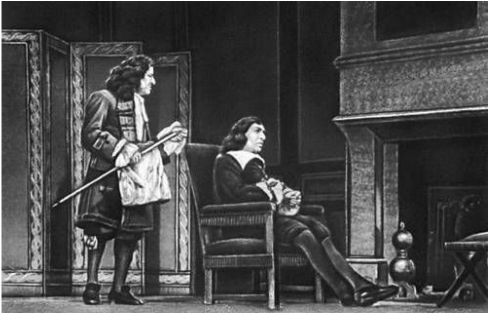
Мольер. Сцена из спектакля «Тартюф». Театр «Комеди Франсез». 1954.