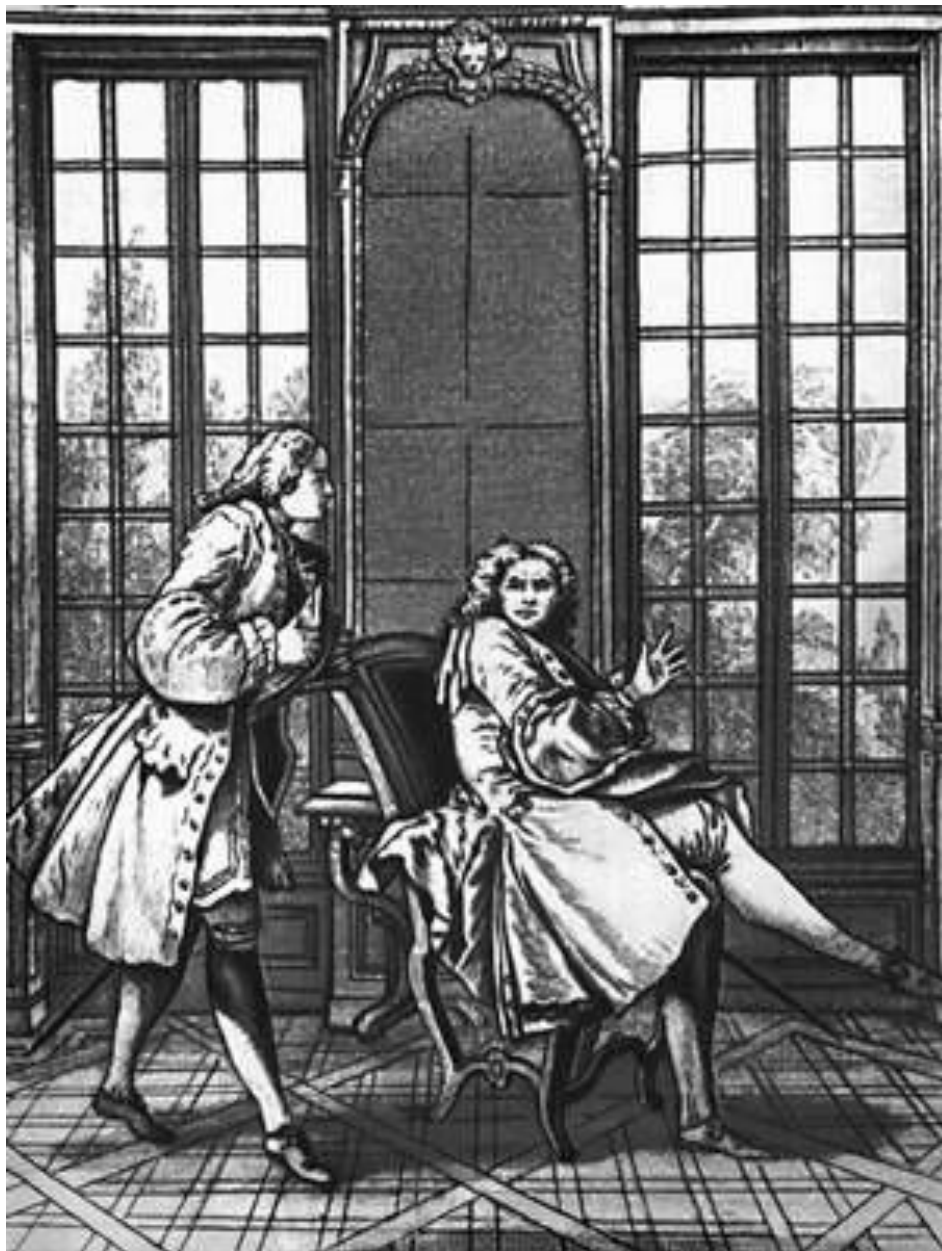
Мольер. «Мизантроп». 1734. Резцовая гравюра Л. Кара по рисунку Ф. Буше.