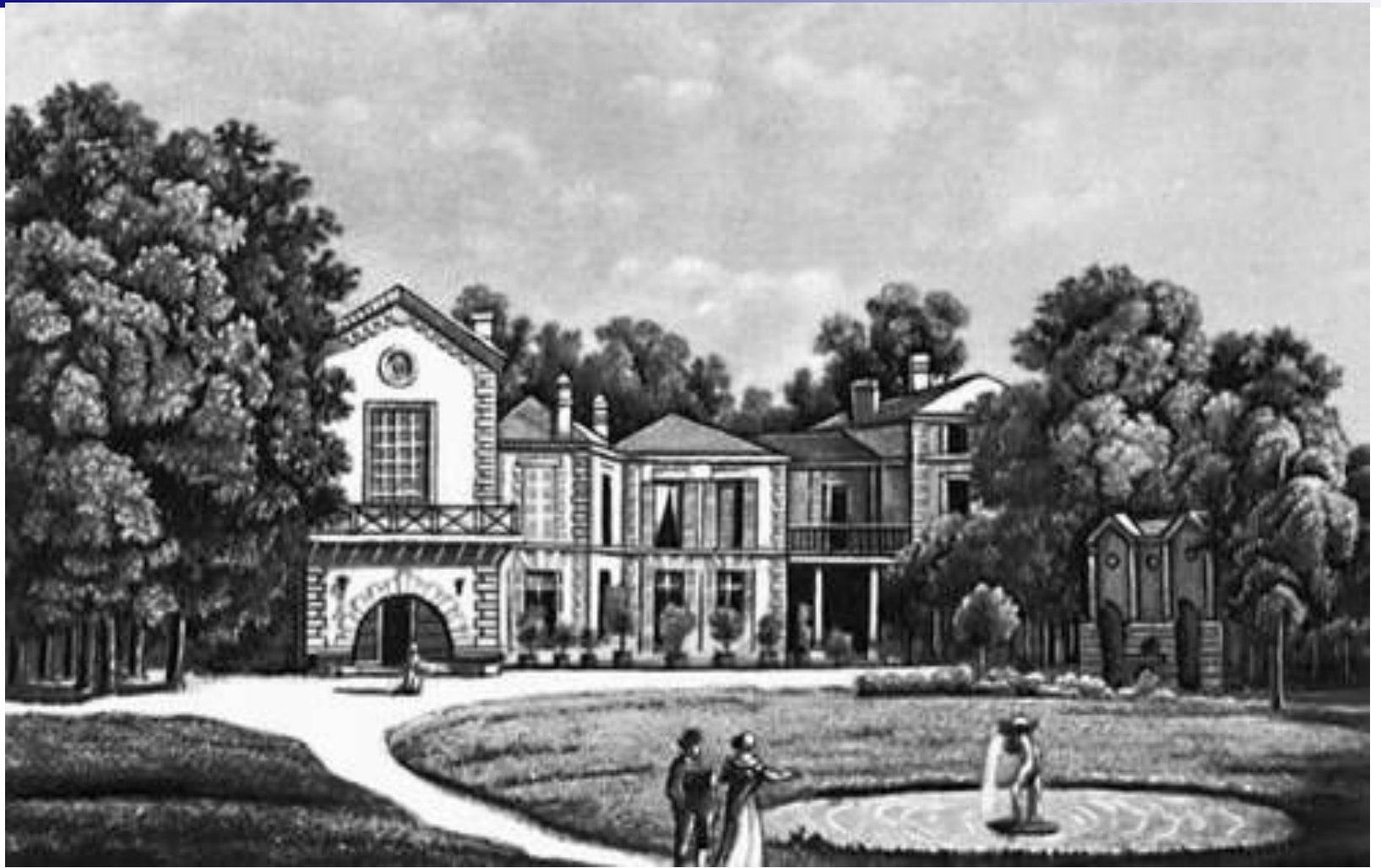
Дом Мольера в Отёй. Гравюра 18 в.