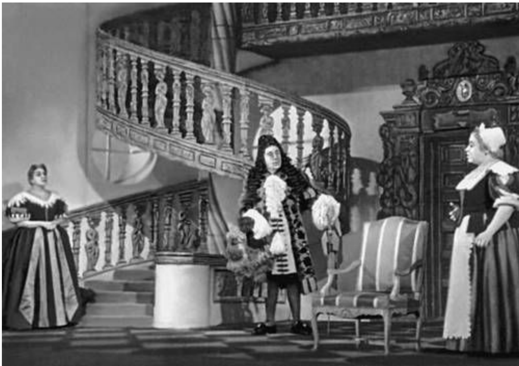
Сцена из спектакля «Мещанин во дворянстве» Мольера. Франция. Театр «Комеди Франсез». 1954 (гастроли в СССР).