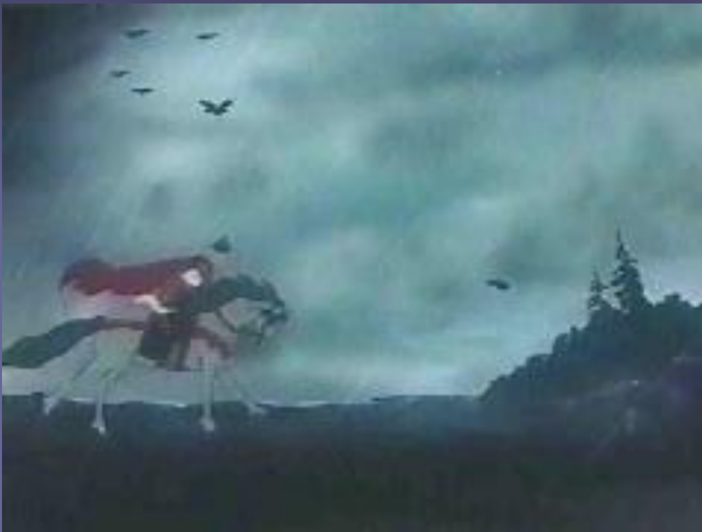
Фрагмент из мультфильма «Сказка о мертвой царевне и семи богатырях».