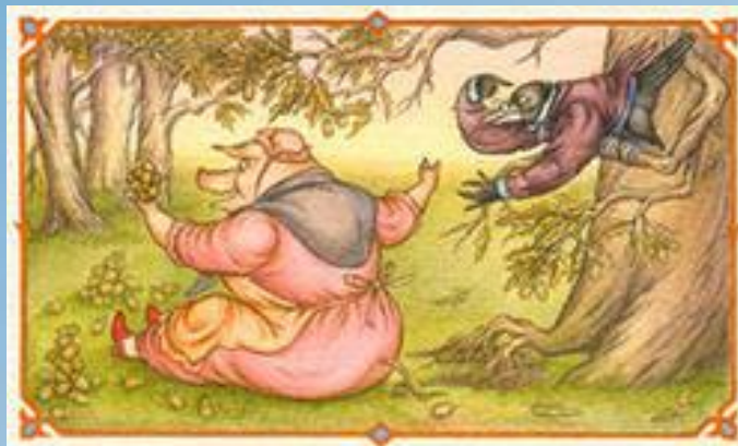
/Свинья. «Свинья под дубом»/