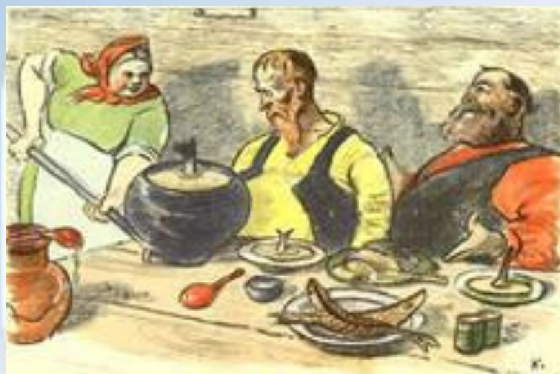
/Демьян. «Демьянова уха»/