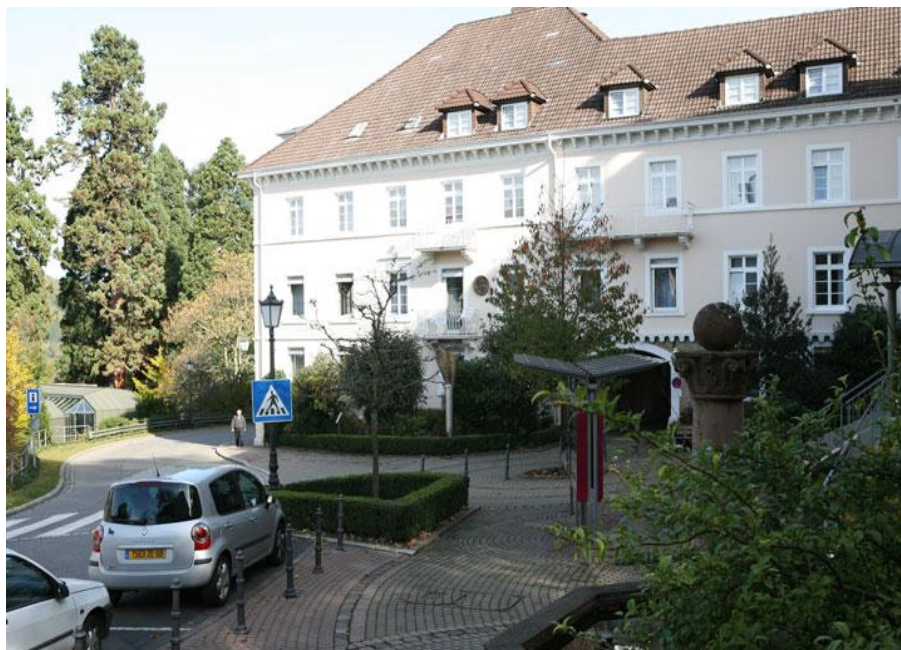
Дом, в котором провёл свои последние дни А.П.Чехов