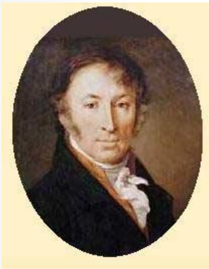
Карамзин Николай Михайлович (1766—1826)