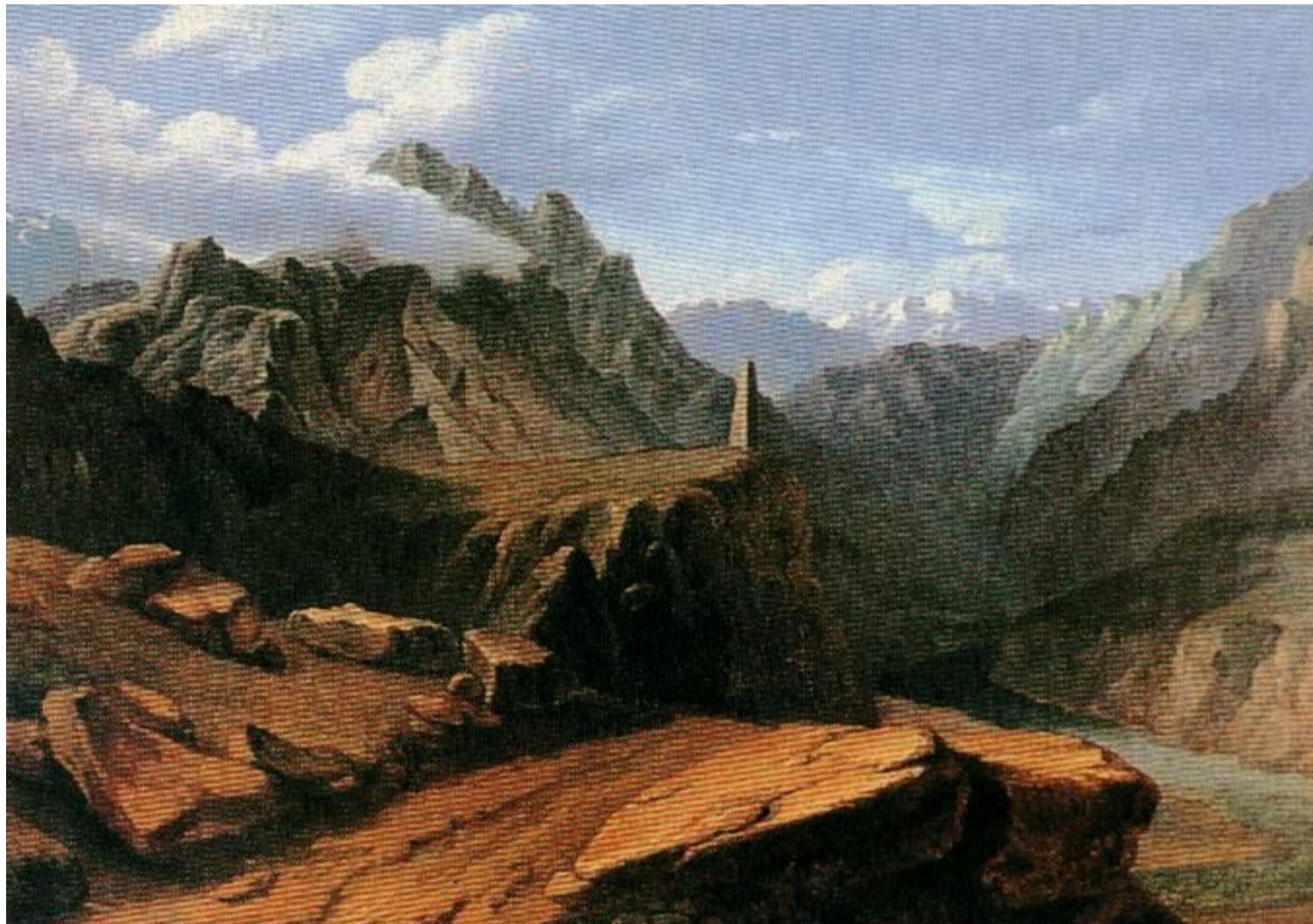
Кавказ. Акварель М.Ю.Лермонтова.