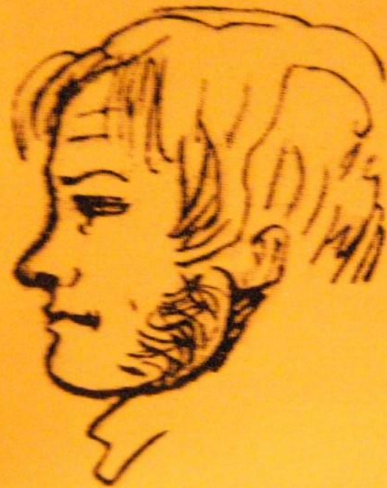
Рисунок А. Пушкина И. И. Пущин, друг поэта. 1826