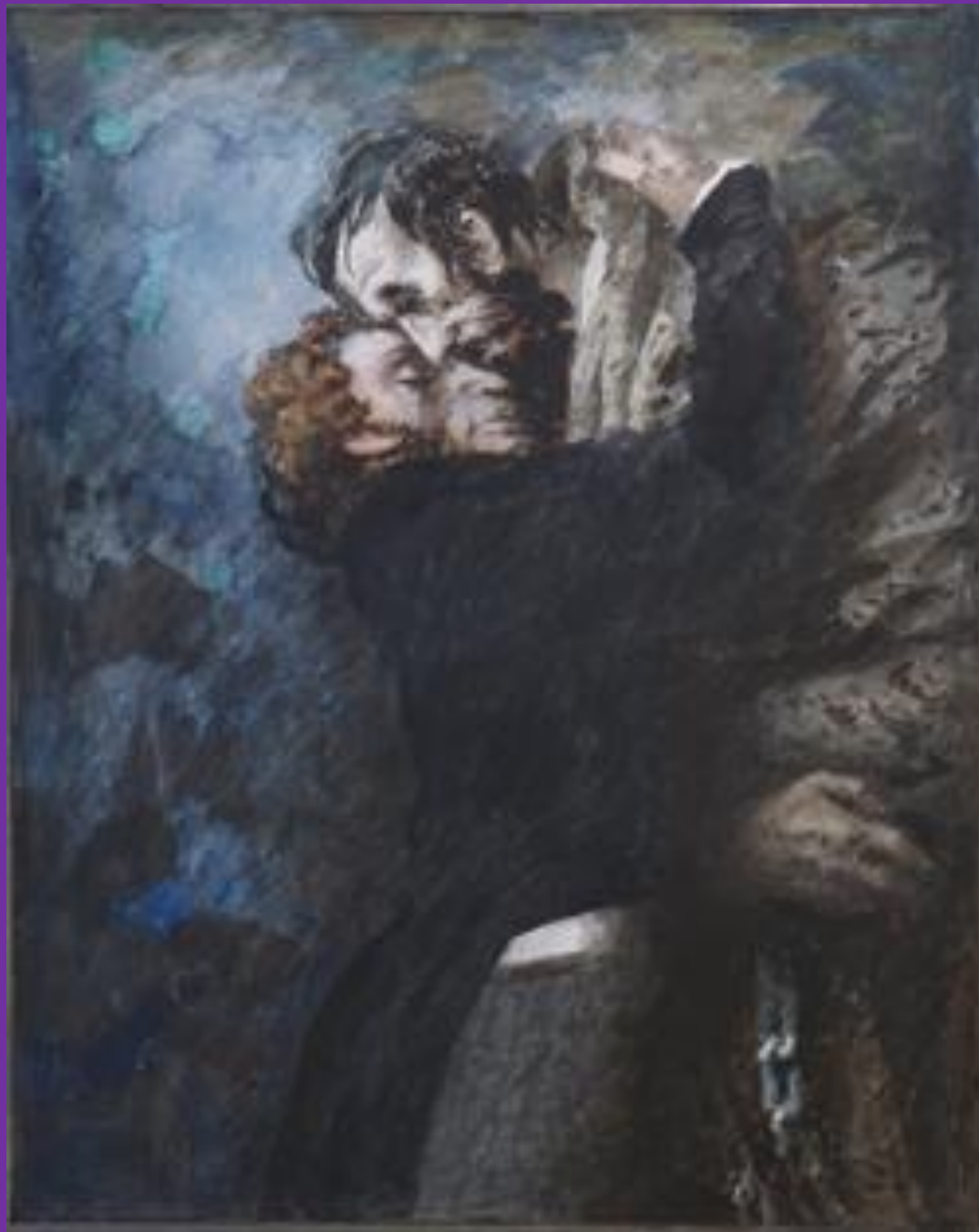
Последняя встреча Пушкина и Кюхельбекера