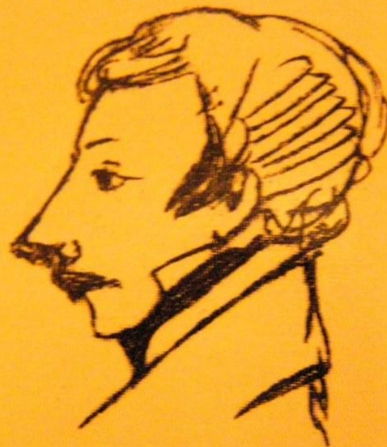
Рисунок А. Пушкина В. К. Кюхельбекер, друг Пуш- кина. 1826