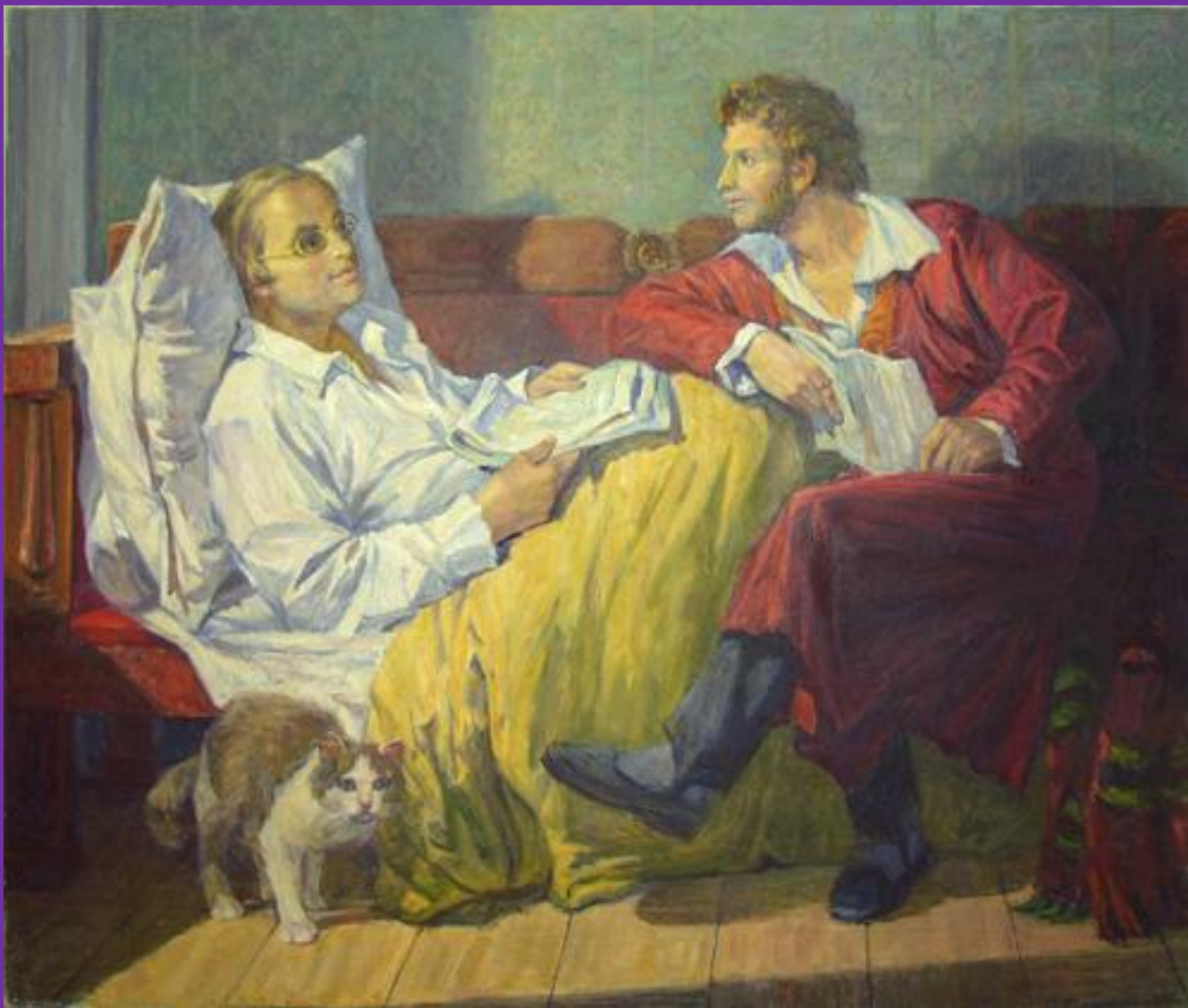
Дельвиг и Пушкин в Михайловском