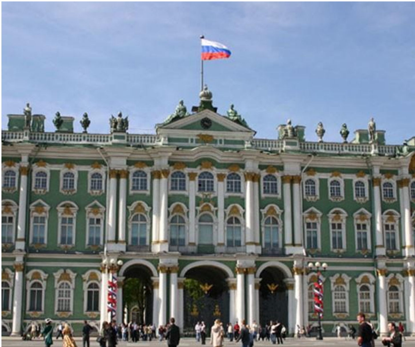
Государственный Эрмитаж (бывший Зимний дворец). Архитектор Б.Растрелли