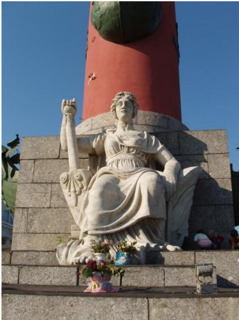
Фрагмент Гостраальной колонны. Архитектор Тома де Томон