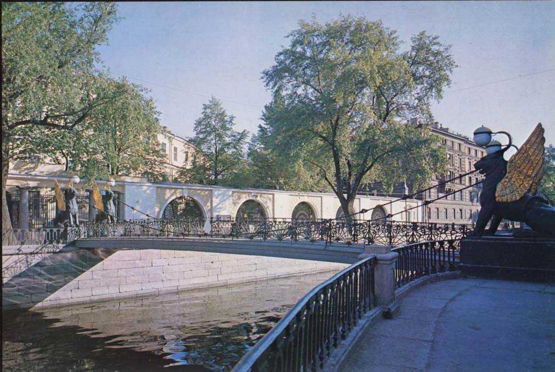
Банковский мостик на канале Грибоедова. 1825 – 1826 гг. Скульптор П.Соколов, инженер Г.Треттер