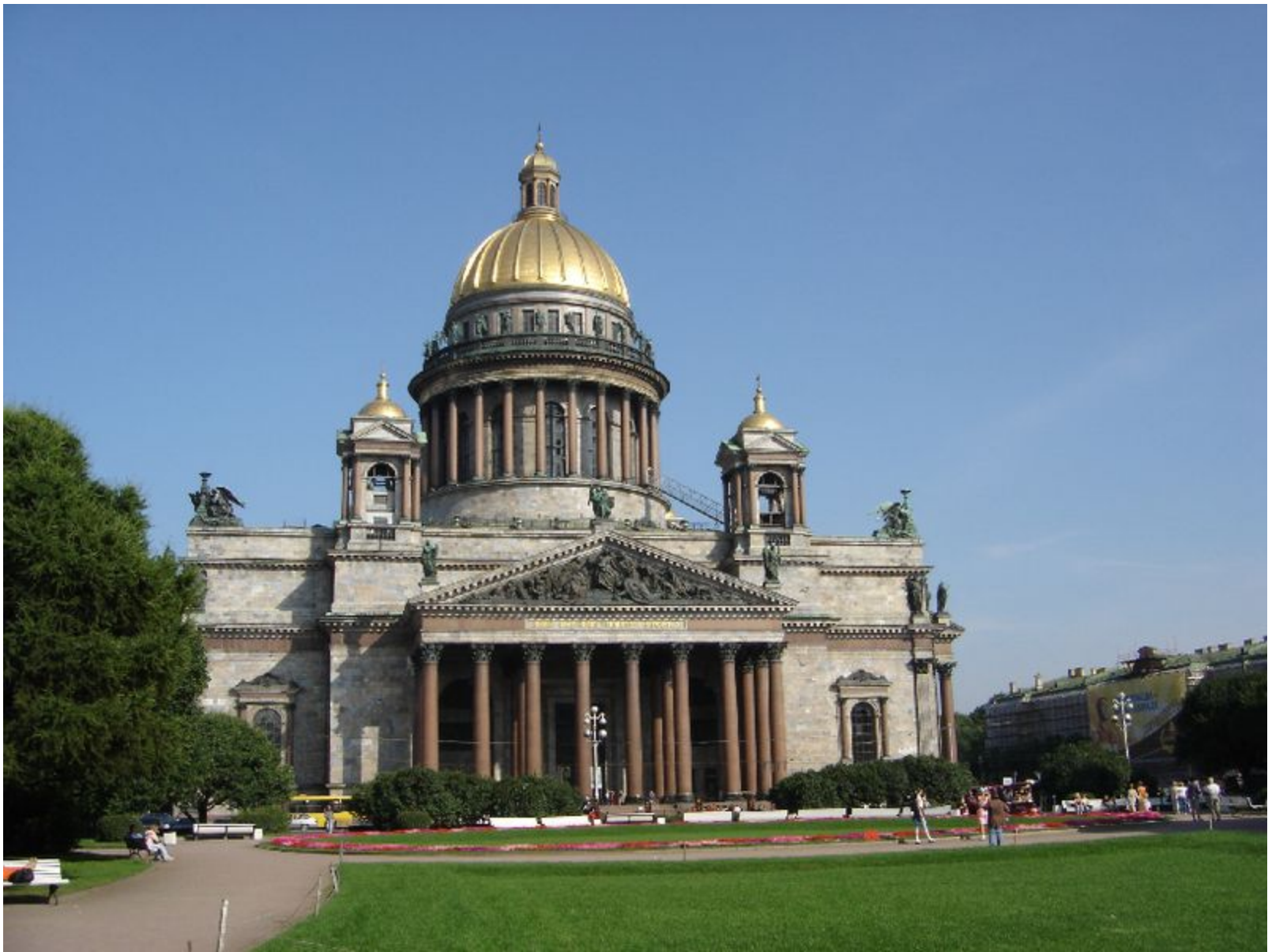
Исакиевский собор. Архитектор О. Монферран