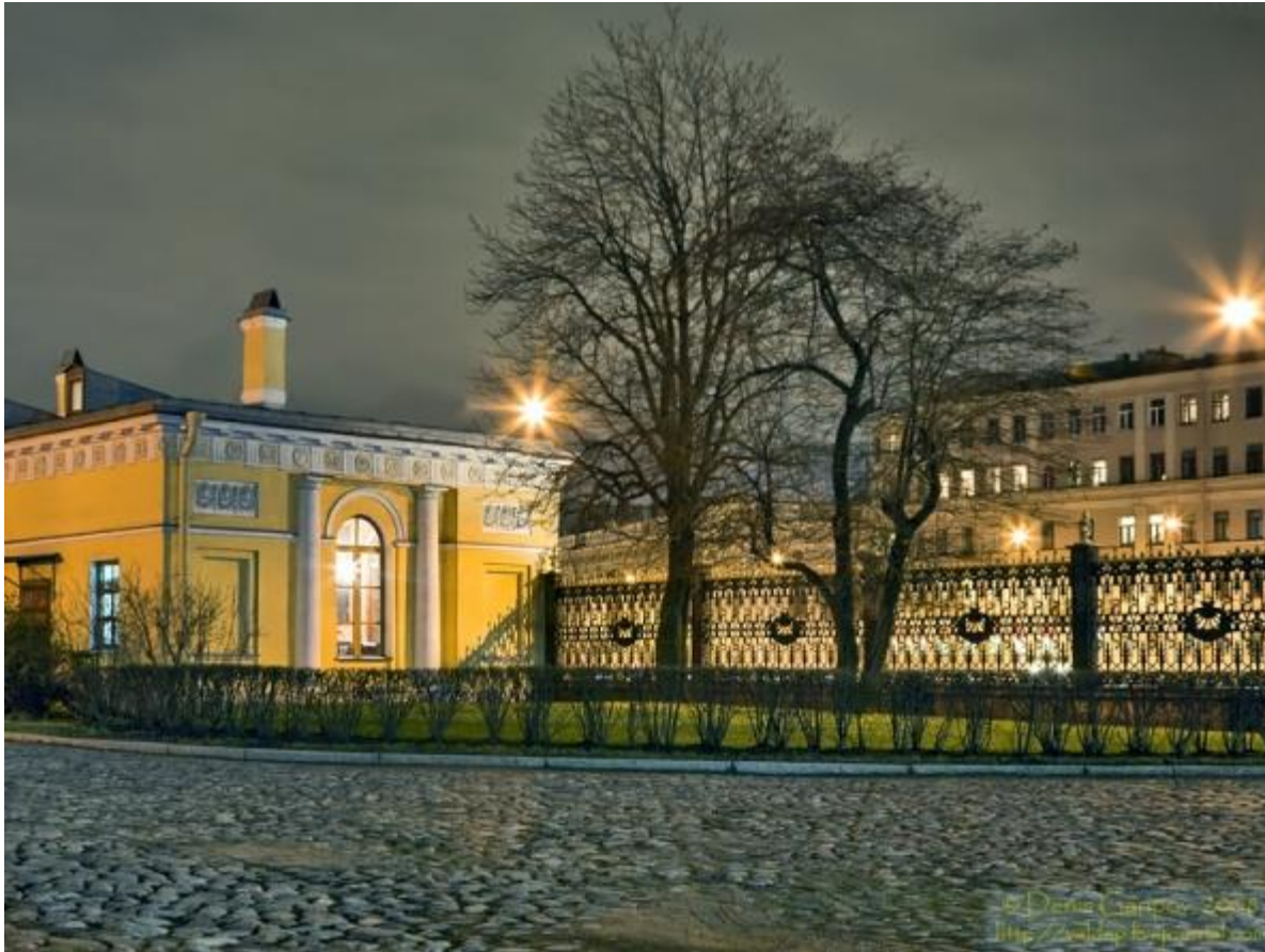
Здание бывшего Шереметевского дворца. Середина XVIII века Архитекторы Ф. Аргунов, С. Чевакинский