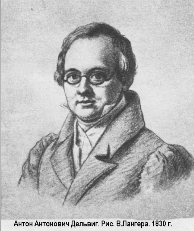
Антон Антонович Дельвиг. Рис. В.Лангера. 1830 г.

«Пушкин! Он и в лесах не укроется; Лира выдаст его громким пением... И от смертных восхитит бессмертного Аполлон на Олимпе торжествующий». А. А. Дельвиг