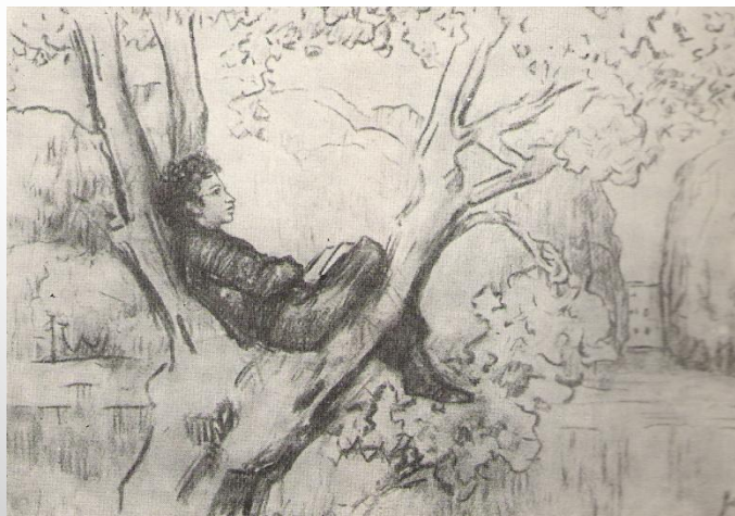
Пушкин-лицеист за чтением в Царскосельском парке