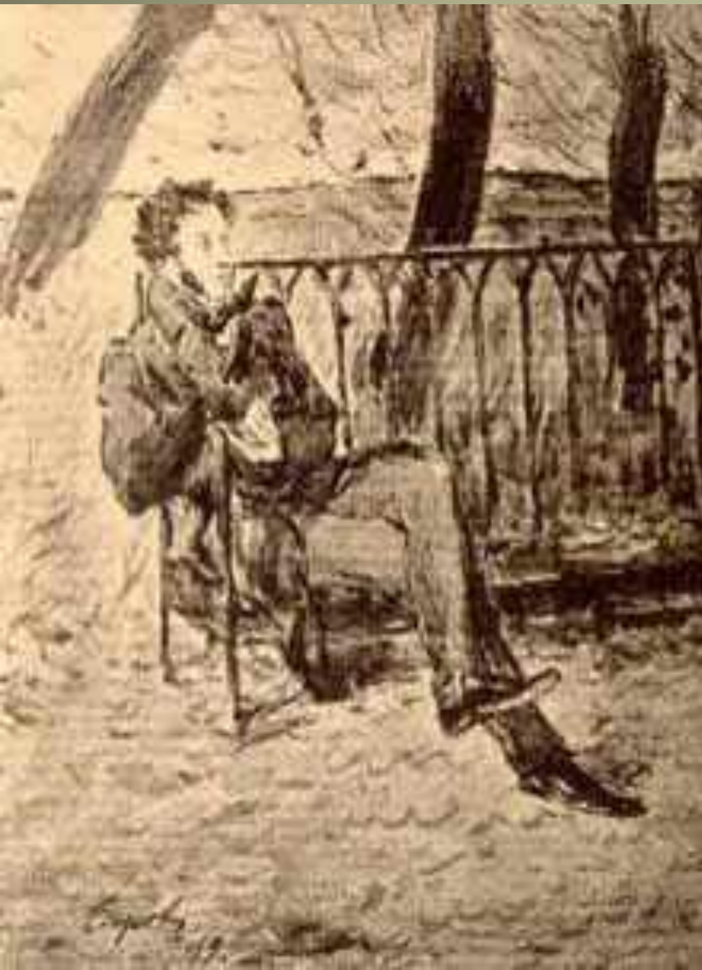
В.А. Серов. "Пушкин в парке"