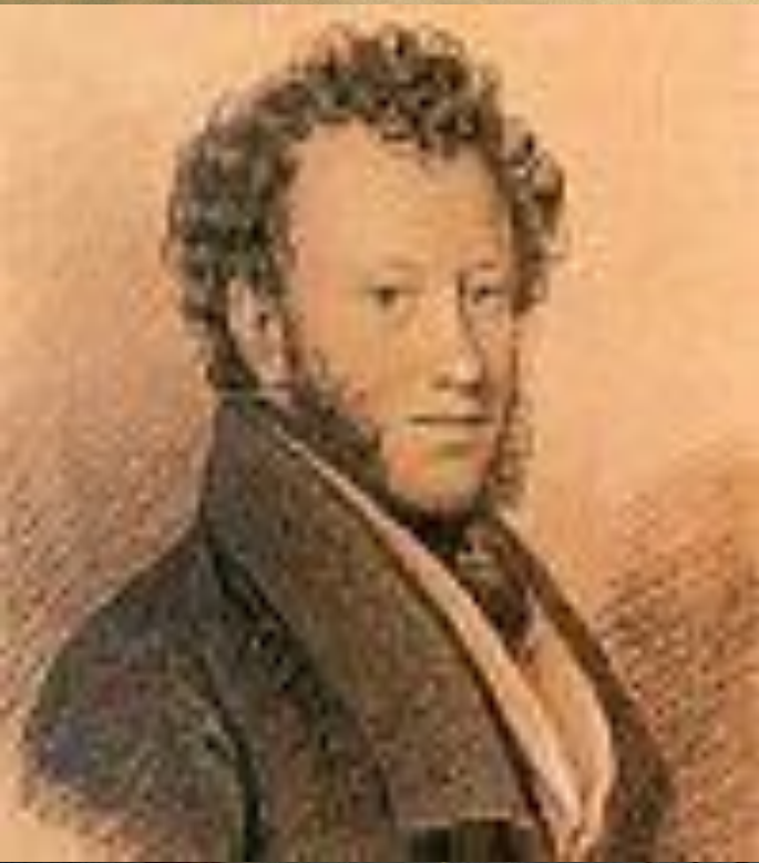
Рисунок выполнен итальянским карандашом обрусевшего француза Ж.Вивьена относящегося к осени 1826г. Художник сумел передать черты характера поэта: душевную мягкость, сердечность, простодушие, детскую незащищенность натуры.