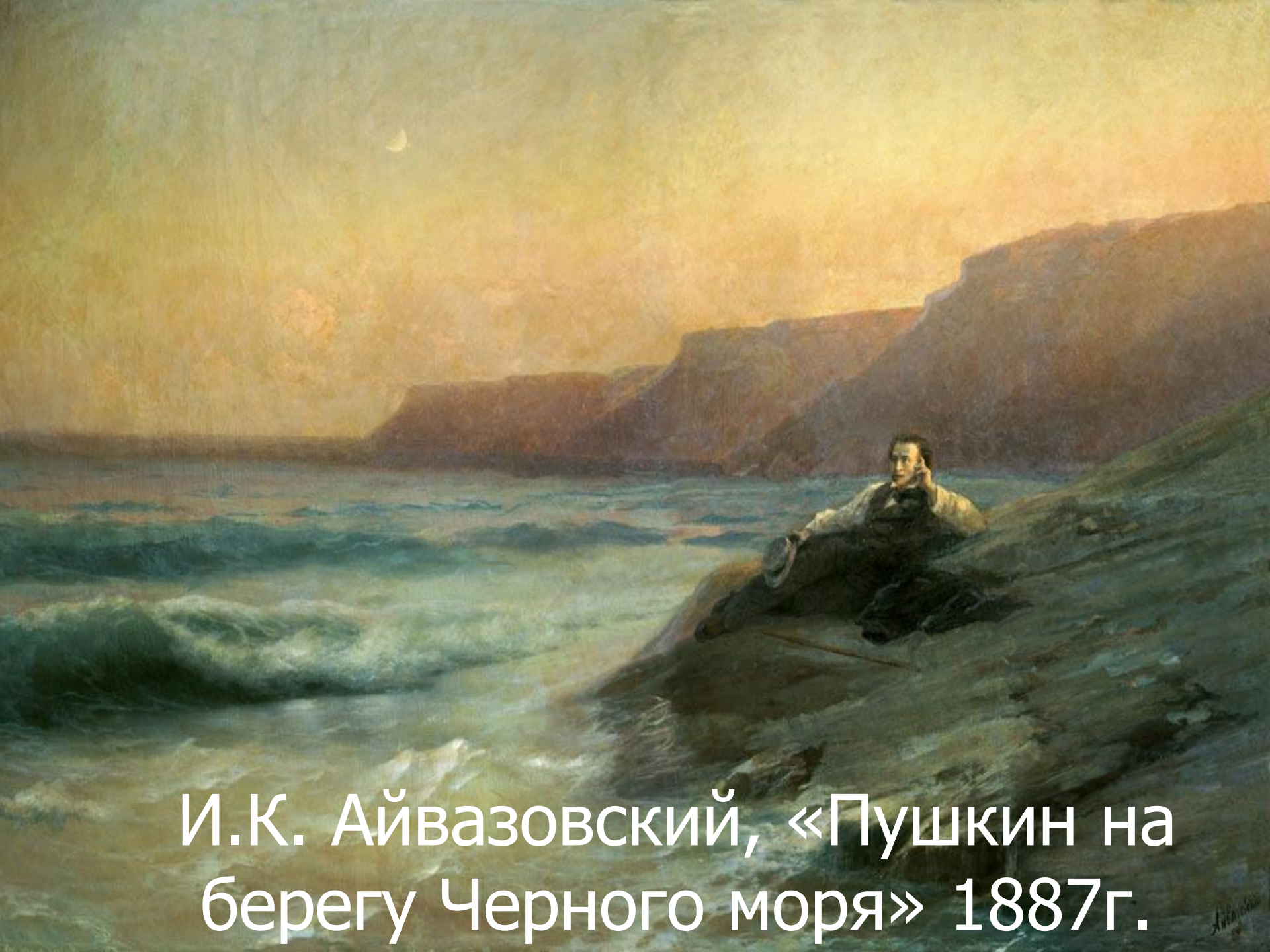
И.К. Айвазовский, «Пушкин на берегу Черного моря» 1887г.