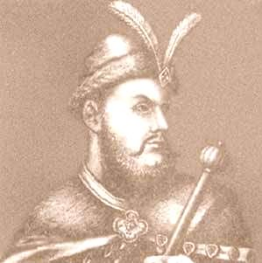
Гетман Петр Дорошенко