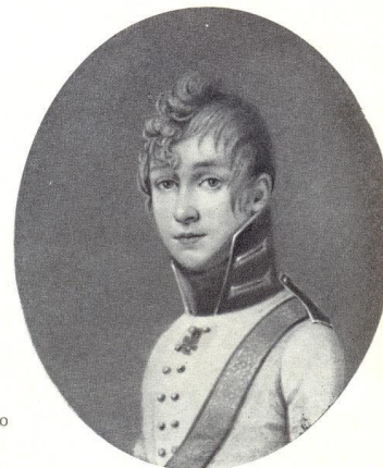
С. Н. Тургенев. Портрет работы неизвестного художника

«Я родился и вырос в атмосфере, где царили подзатыльники, щипки, колотушки, пощёчины и пр.»