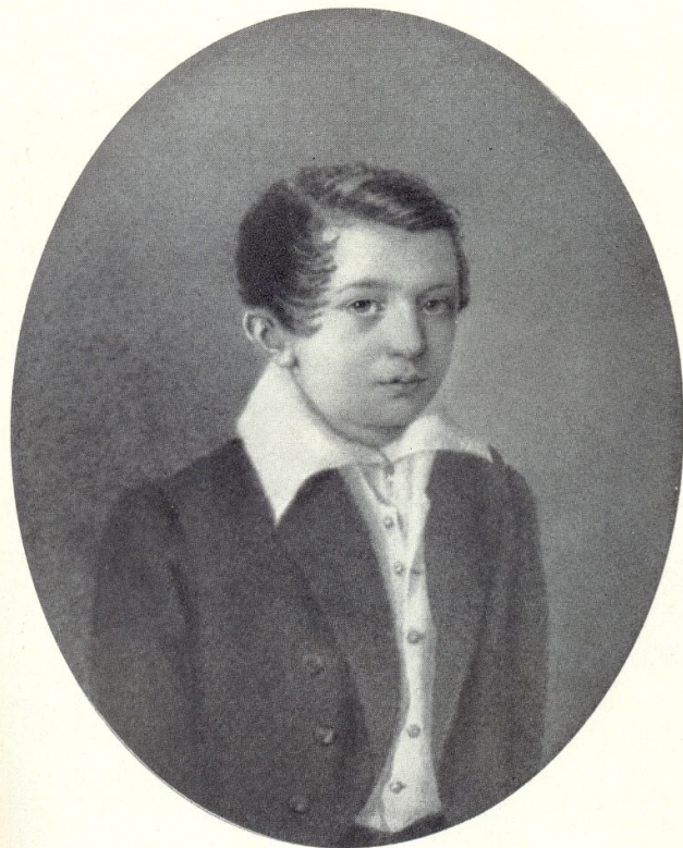
И. С. Тургенев в 1830 году. Акварель