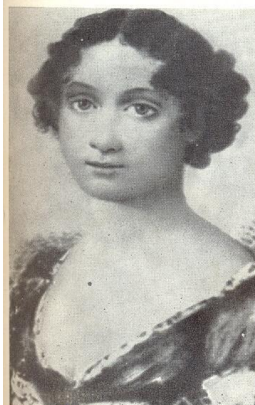
В. П. Тургенева. Портрет работы неизвестного художника