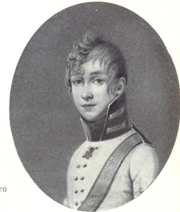
С. Н. Тургенев. Портрет работы неизвестного художника

«Я родился и вырос в атмосфере, где царили подзатыльники, щипки, колотушки, пощёчины и пр.»