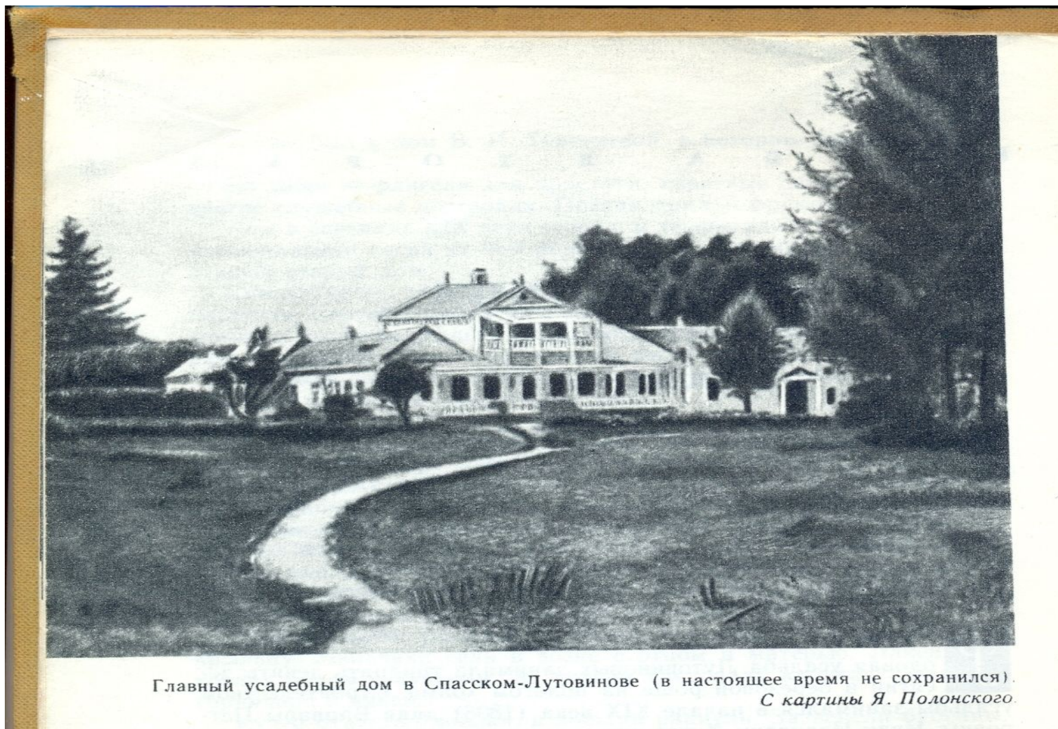
Главный усадебный дом в Спасском-Лутовинове (в настоящее время не сохранился). С картины Я. Полонского.