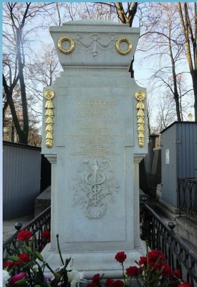
Могила М.В.Ломоносова в Александро-Невской лавре

Умер М.В.Ломоносов 4 апреля 1765г. Погребен в Петербурге.