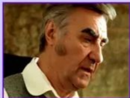
Николай Петрович Кирсанов

Любит Фенечку по-отечески нежно и преданно, счастлив от того, что имеет от неё сына.