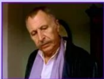
Павел Петрович Кирсанов

Отнёсся к Фенечке доброжелательно и воспринял выбор отца как должное. В сыне Фенечки не видит соперника-наследника.