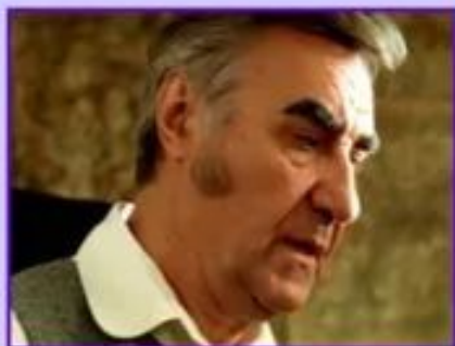
Николай Петрович Кирсанов

Любит Фенечку по-отечески нежно и преданно, счастлив от того, что имеет от неё сына.