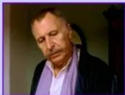
Павел Петрович Кирсанов

Отнёсся к Фенечке доброжелательно и воспринял выбор отца как должное. В сыне Фенечки не видит соперника-наследника.