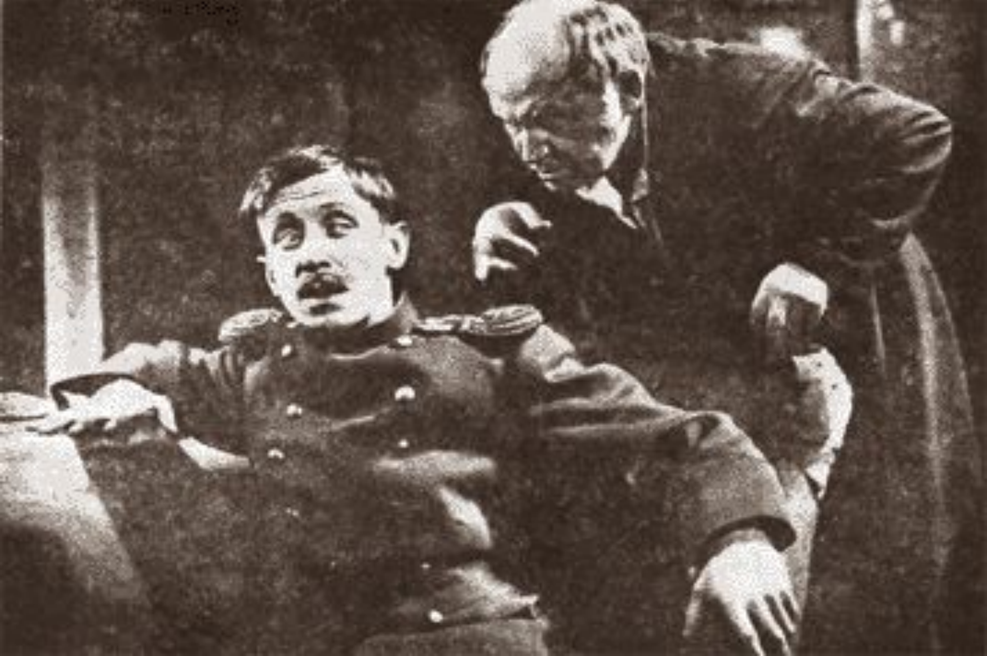
Иудушка с сыном.