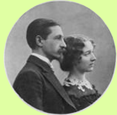
«Весна 1907 г. Первое путешествие в Сирию, Палестину».

Личные вещи Бунина: карта Восточной Азии, путеводители, кожаный бумажник, пробковая шляпа, янтарные и кипарисовые четки — были привезены им из путешествий по Востоку. Орел. Литературно-мемориальный музей И. А. Бунина