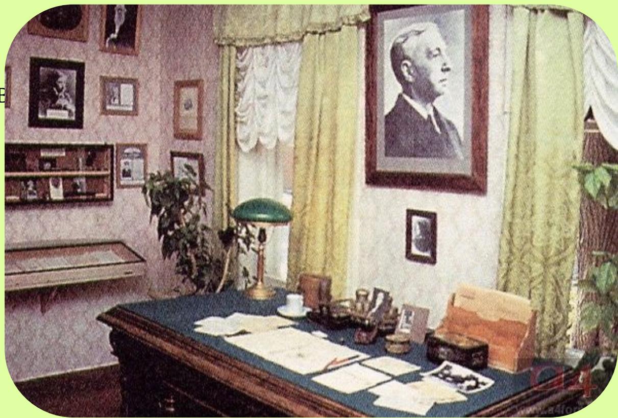
Дом-музей И.А. Бунина в Ельце. Рабочий кабинет писателя

Детство будущего писателя, родившегося в Воронеже, в 1870-м, в семье орловских помещиков, прошло на хуторе Бутырки, под Ельцом.