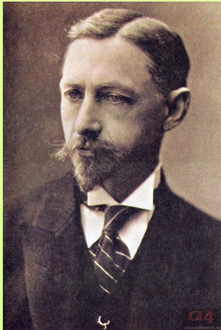
И.А. Бунин. Фото 1915 г.

В 1915 г. в издательстве А. Ф. Маркса выходит полное собрание сочинений Бунина.