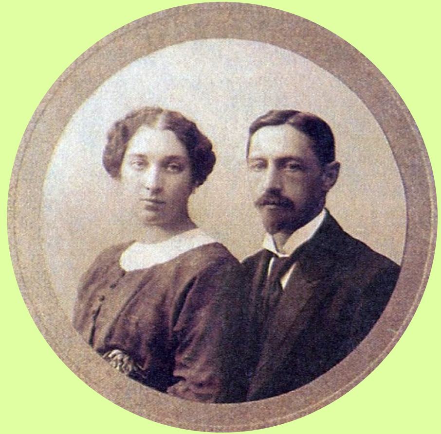
И.А. Бунин с женой В.Н. Муромцевой

После целого ряда испытаний Бунины остаются во Франции, где пройдет практически вся вторая половина жизни писателя, отмеченная написанием 10 книг, сотрудничеством с ведущим «толстым» журналом русского зарубежья «Современными записками», созданием романа «Жизнь Арсеньева».