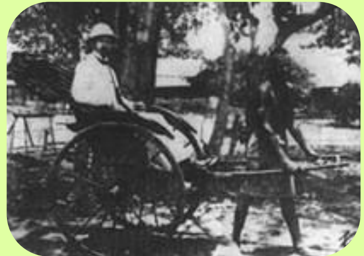
И. А. Бунин на Цейлоне. Март 1911 г.