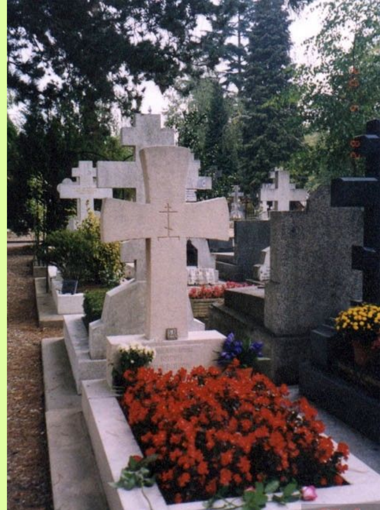
Могила И. А. Бунина на кладбище Сент- Женевьев-де-Буа

Бунин говорил, что «классически заканчивает ту славную литературу, которую начал вместе с Карамзиным Жуковский, а говоря точнее – Бунин, родной, но незаконный сын Афанасия Ивановича Бунина и только по этой незаконности получивший фамилию “Жуковский” от своего крестного отца...»