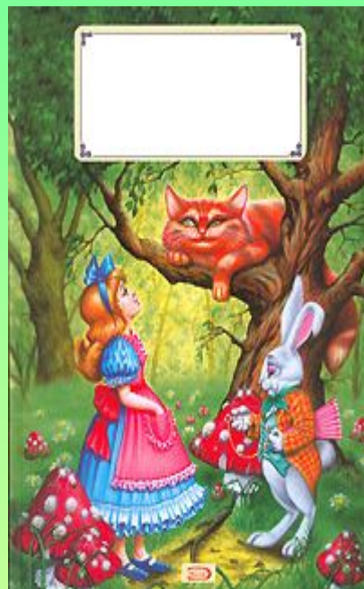
Л. Кэрролл. Алиса в стране чудес