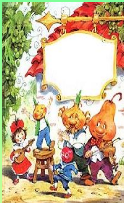
Дж. Родари. Приключения Чиполлино