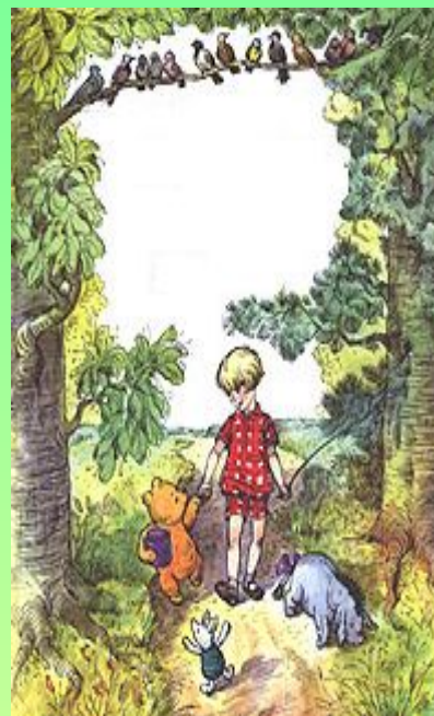
А. Милн, Б. Заходер. Винни-Пух