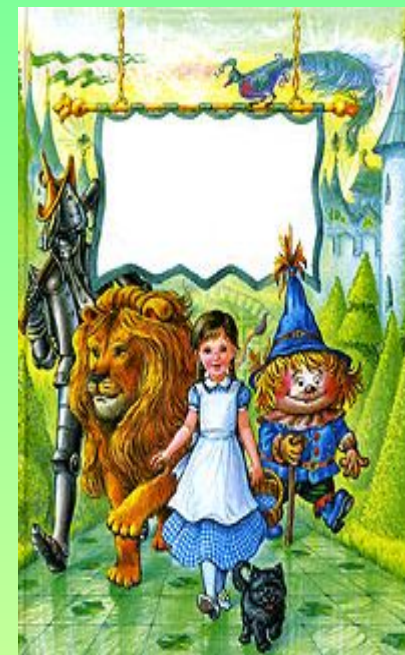
А. Волков. Волшебник Изумрудного города