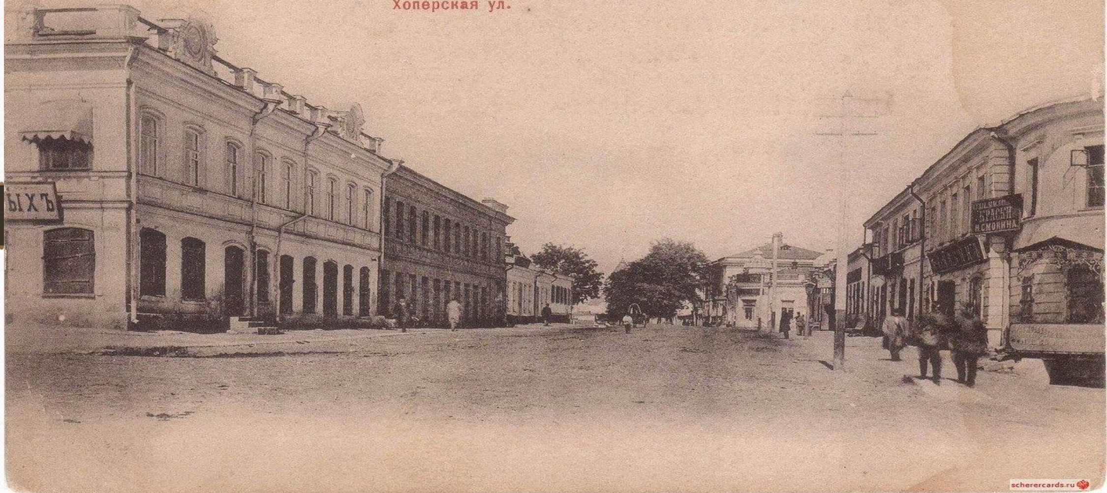
Ставрополь-Губернскій. Хоперская ул.