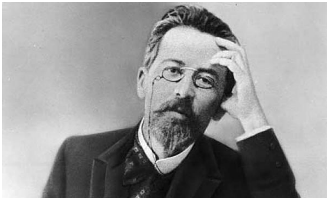
Антон Павлович Чехов (1860 -1904)