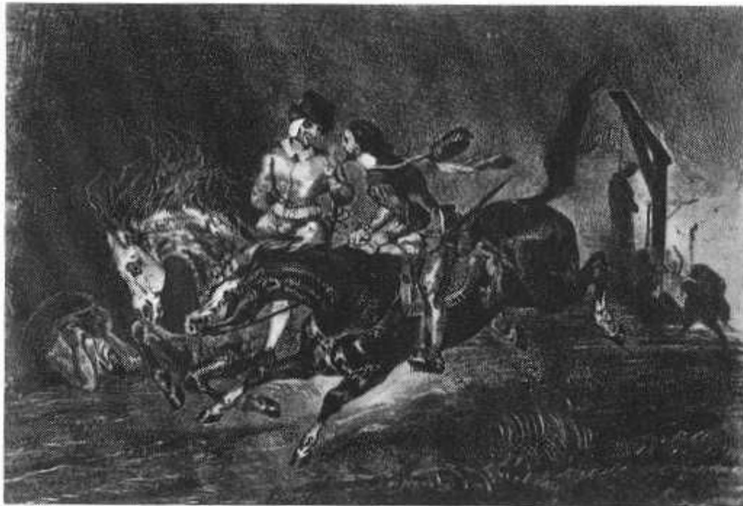
Фауст и Мефистофель. С литографии Эжена Делакруа. 1826