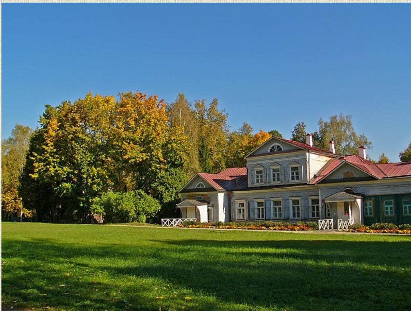
Музей заповедник Абрамцево