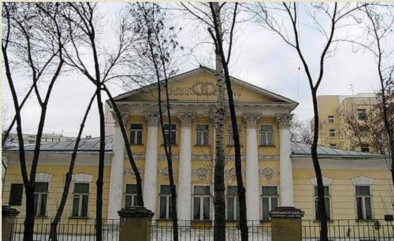
Дом С.Т.Аксакова в Москве