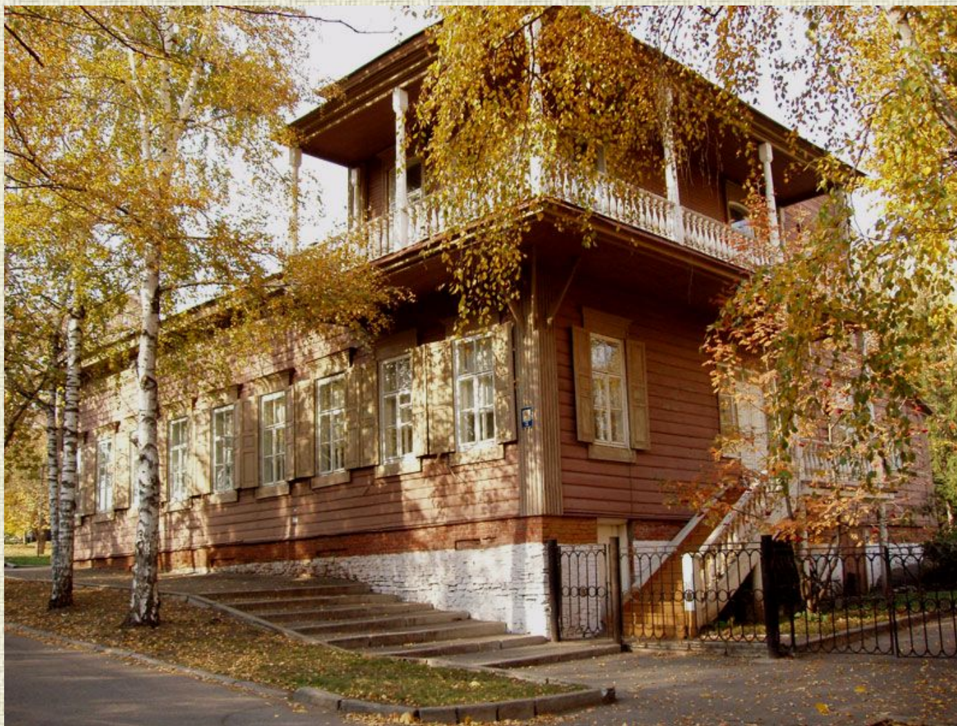
Мемориальный дом-музей С.Т. Аксакова в Уфе