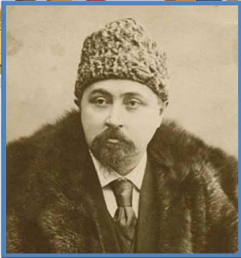
Дмитрий Наркисович Мамин-Сибиряк (1852-1912гг.)