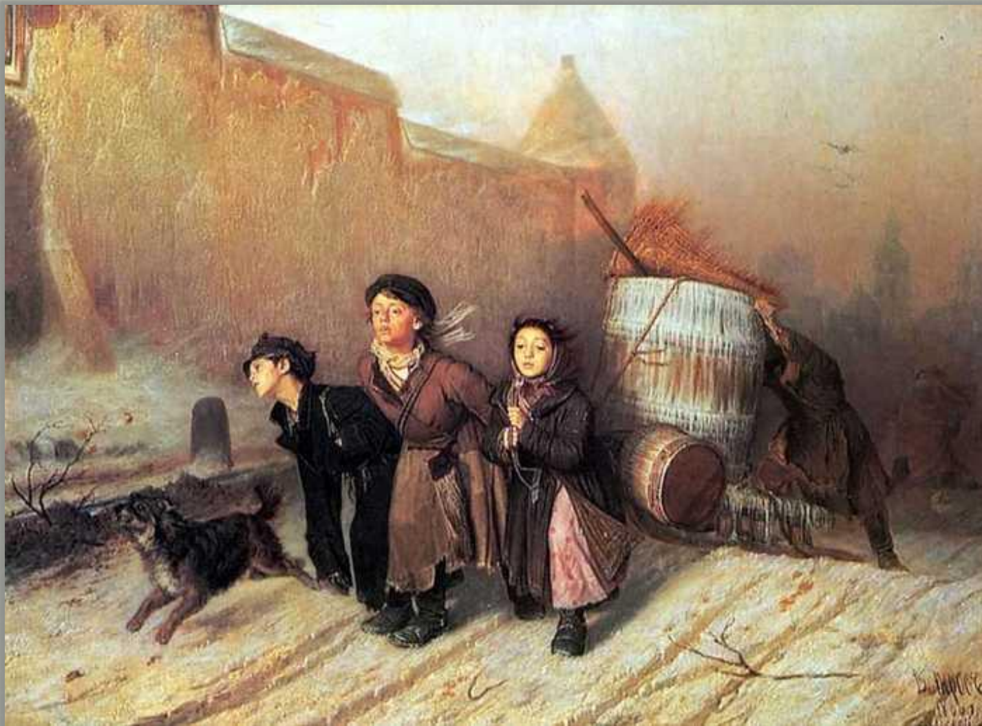
В.Перов «Тройка» (1866 г.)