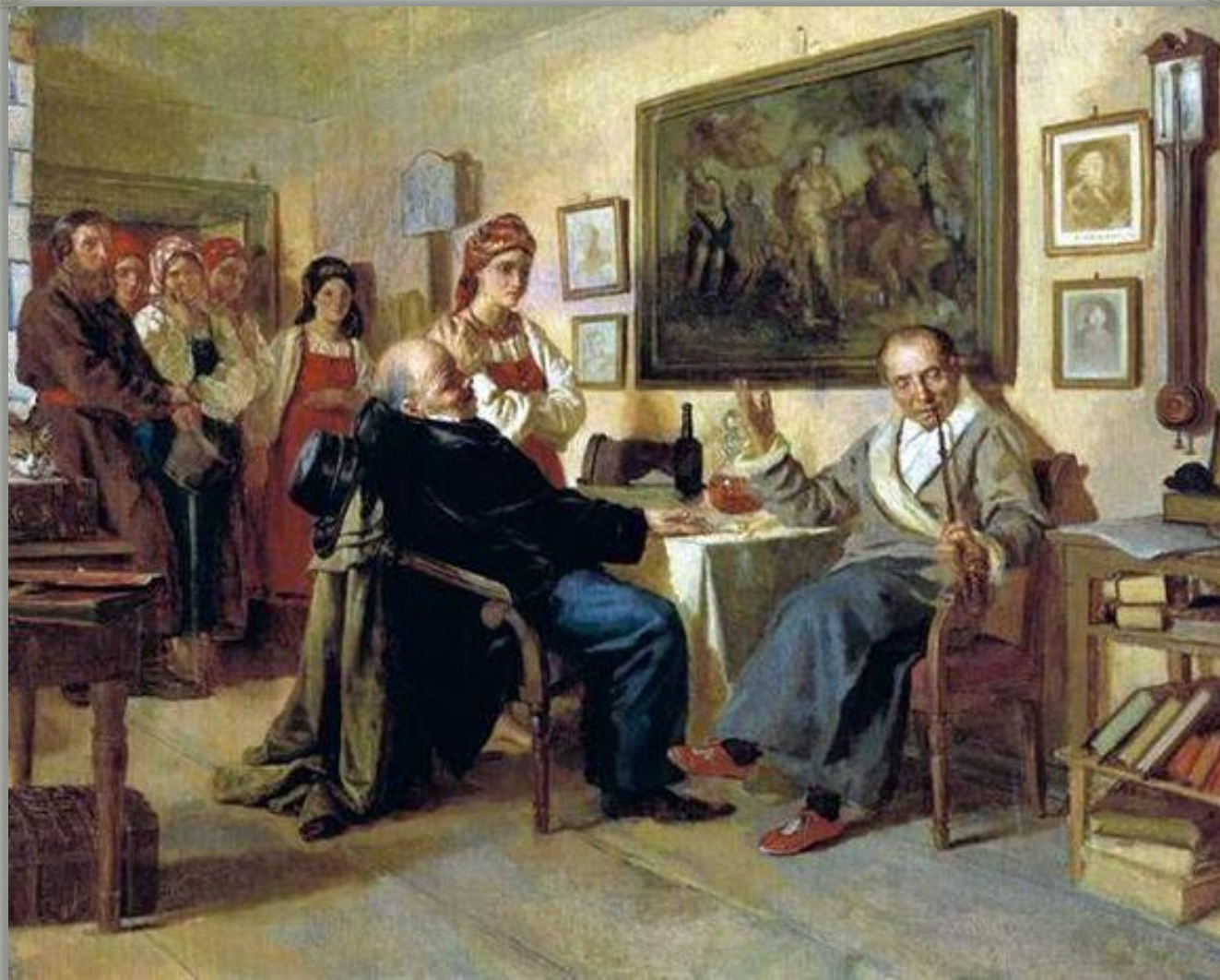
Н.В.Неврев «Торг. Сцена из крепостного быта. Из недавнего прошлого» (1866 г.)