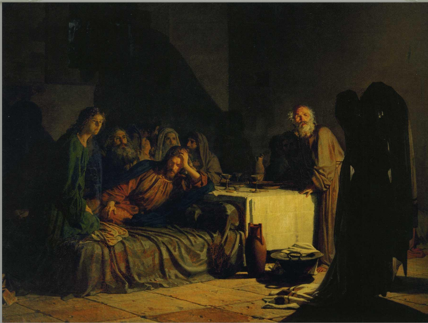
Н.Ге «Тайная ве/черя» (1863 г.)