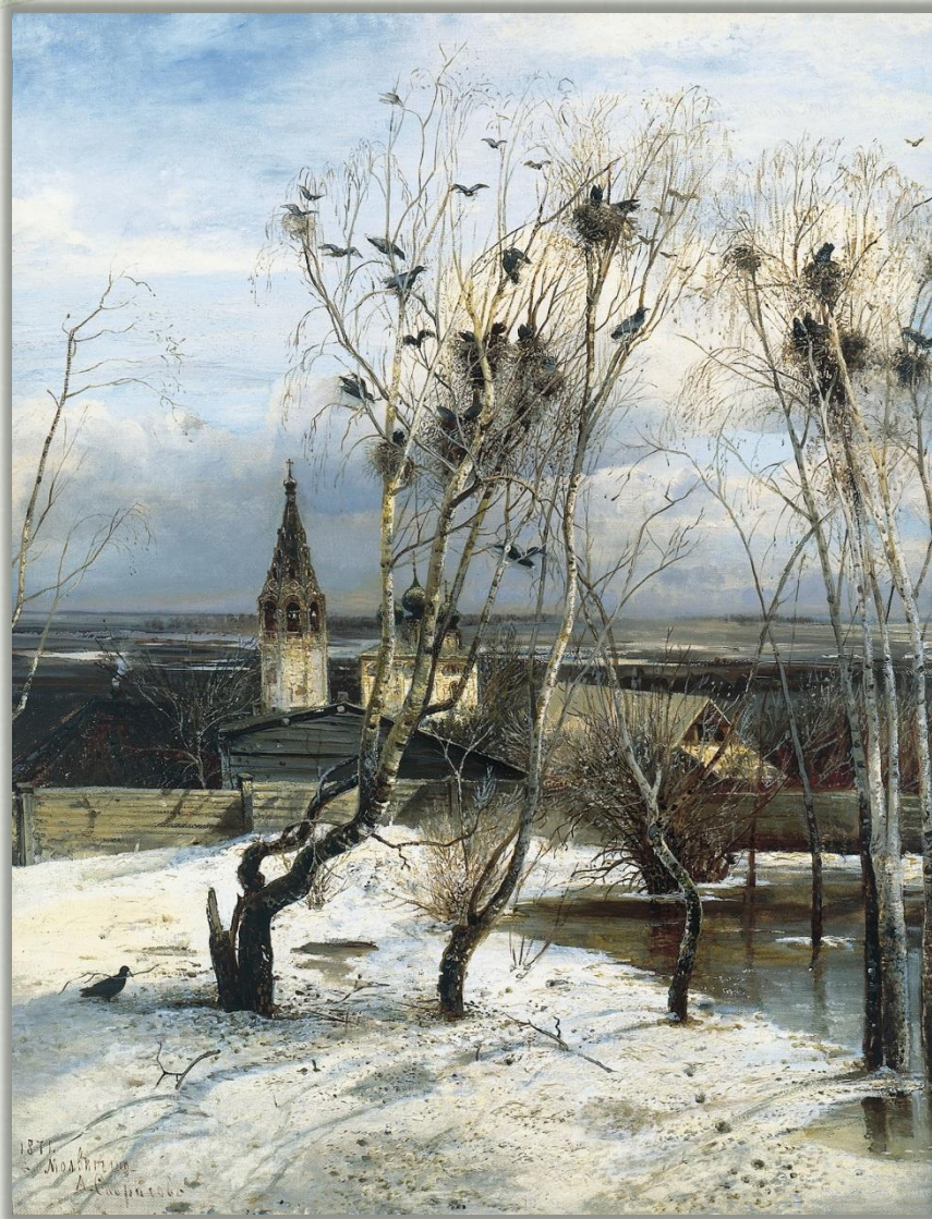
Алексей Саврасов «Грачи прилетели» (1871 г.)