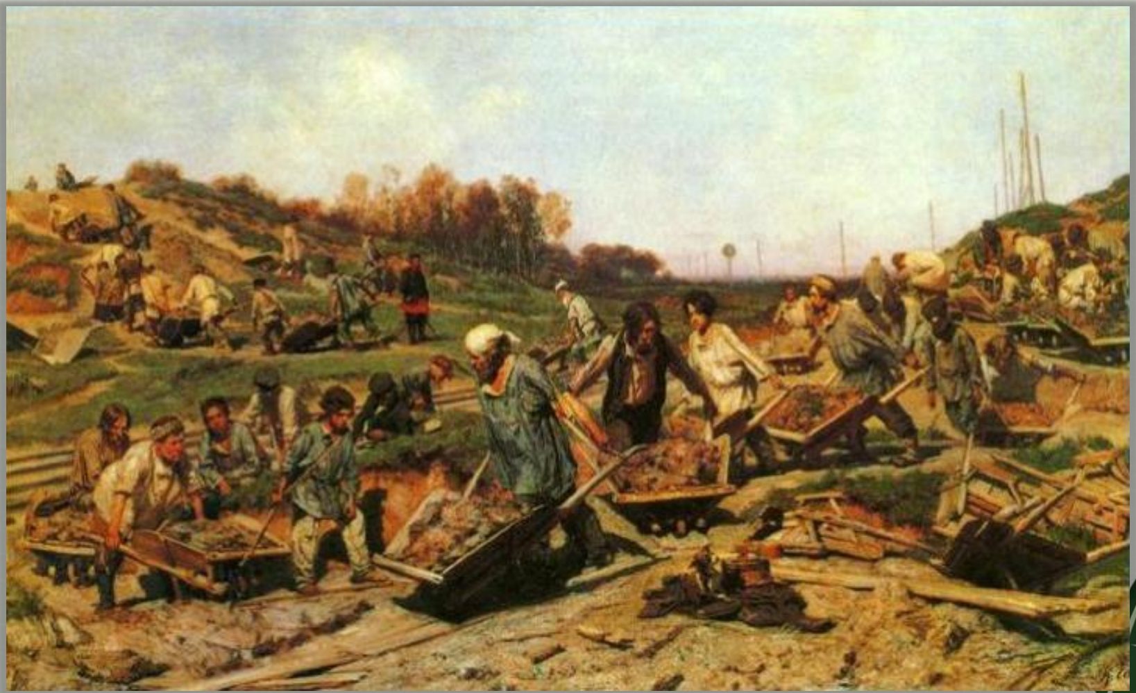
К.Савицкий «Ремонтные работы на железной дороге» (1874 г.)