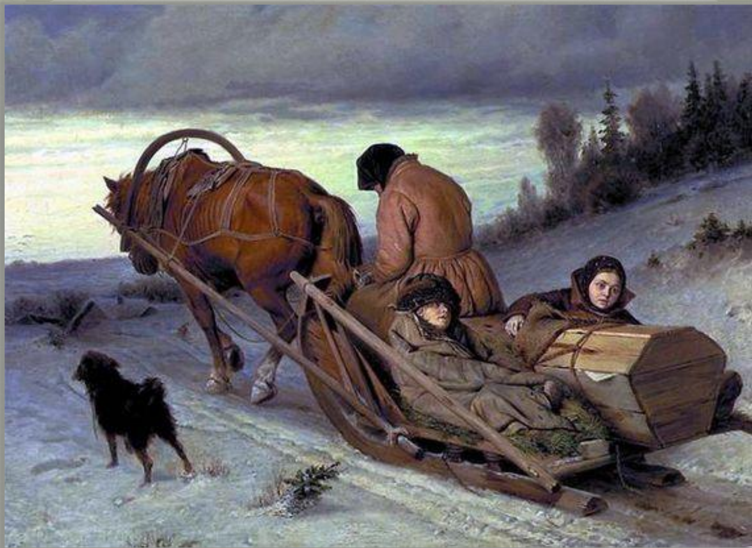
В.Перов «Проводы покойника» (1865 г.)