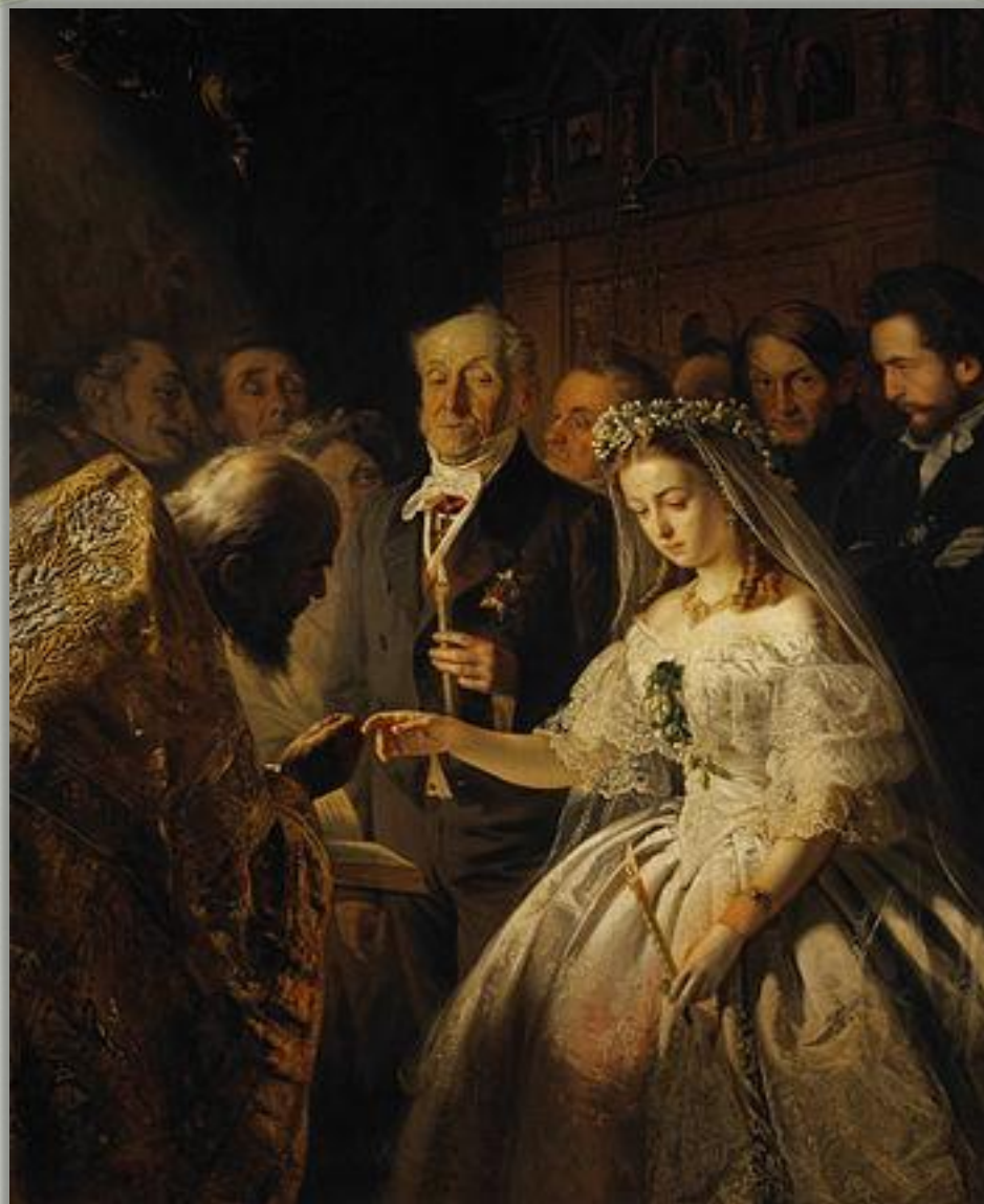
В.Пукирев «Неравный брак» (1862 г.)