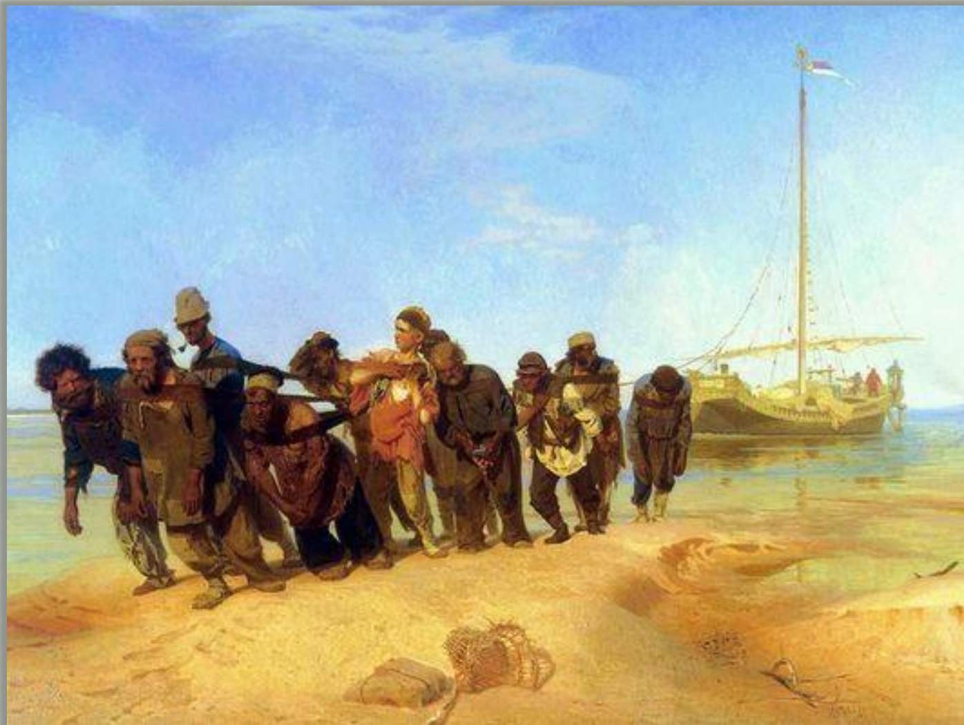
И.Е.Репин «Бурлаки на Волге» (1873 г.)