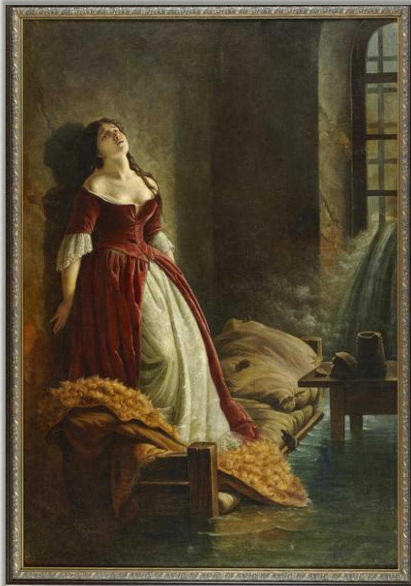
Константин Флавинский «Княжна Тараканова» (1864 г.)