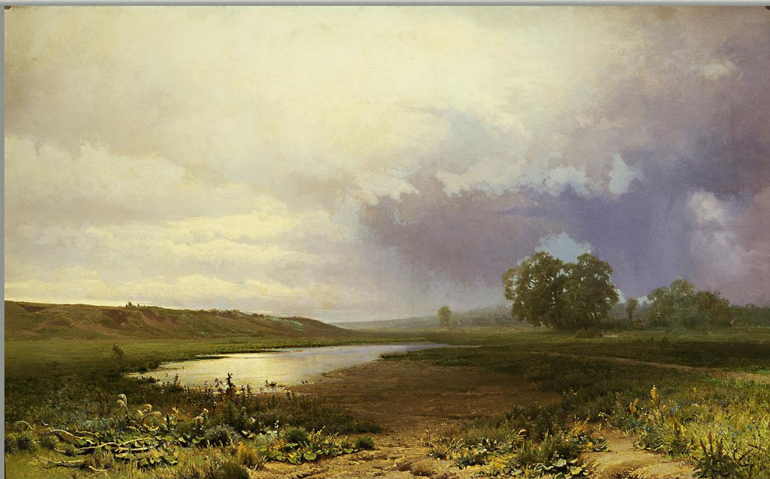
Фёдор Васильев «Мокрый луг» (1872 г.)