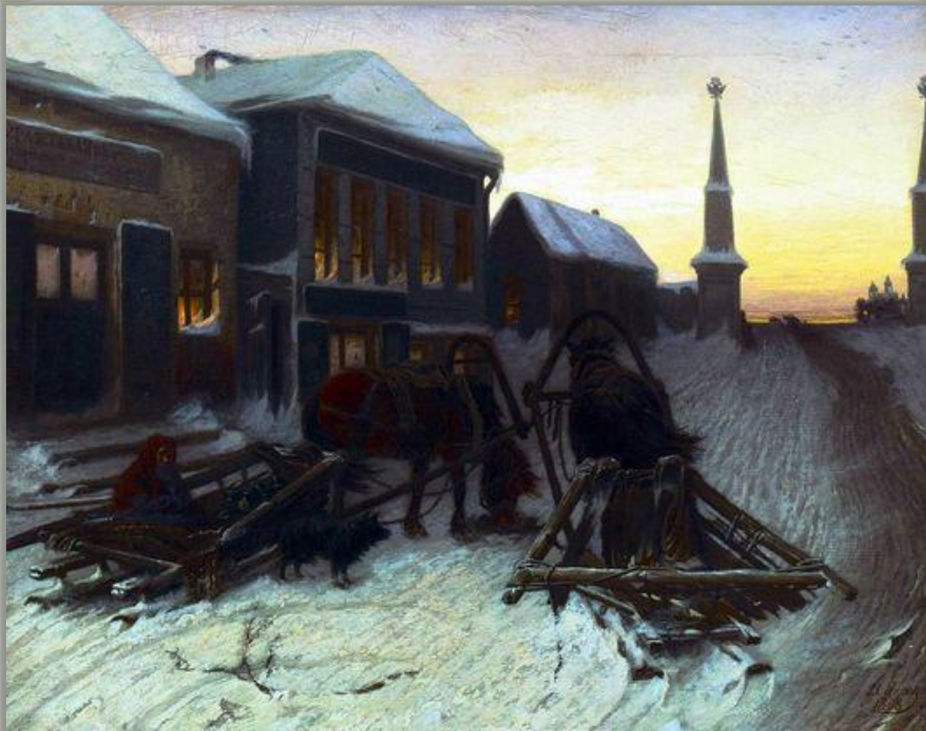
В.Перов «Последний каба́к у заставы»