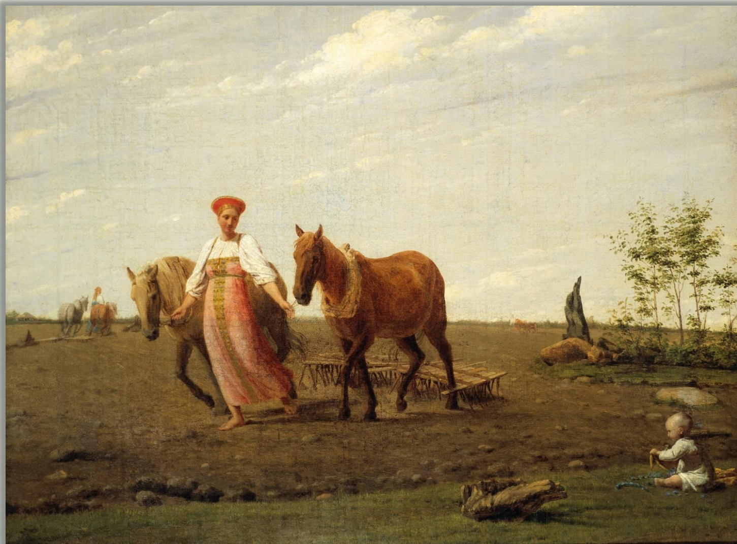
А.Г.Венецианов «На пашне.Весна» (1820-е гг.)