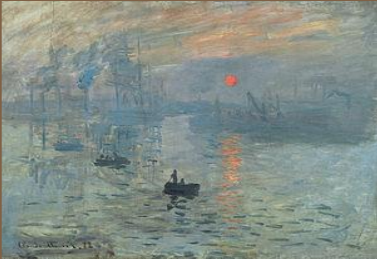
Клод Моне «Впечатление. Восход солнца»