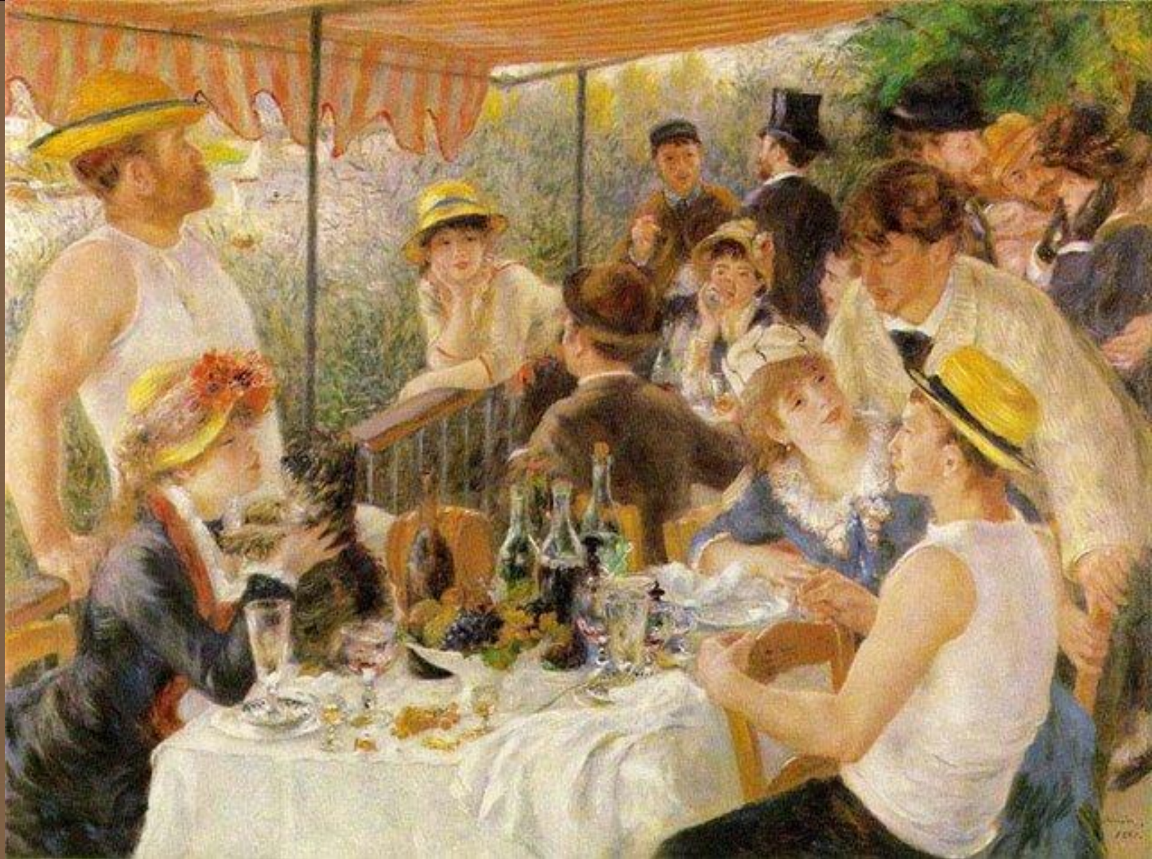
О. Ренуар «Завтрак гребцов»