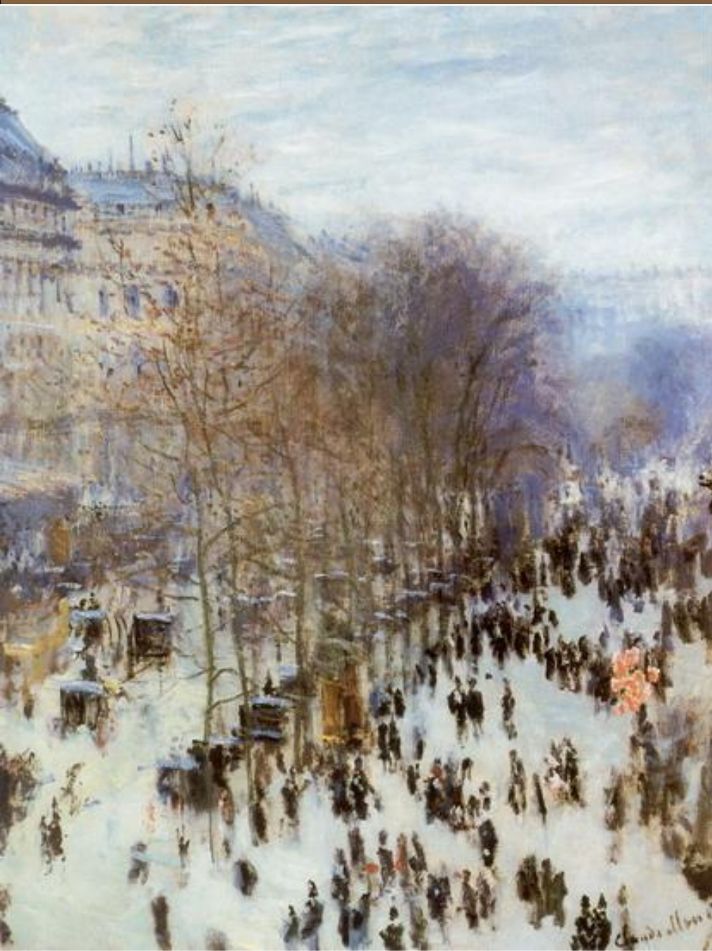
К. Моне «Бульвар Капуцинок»