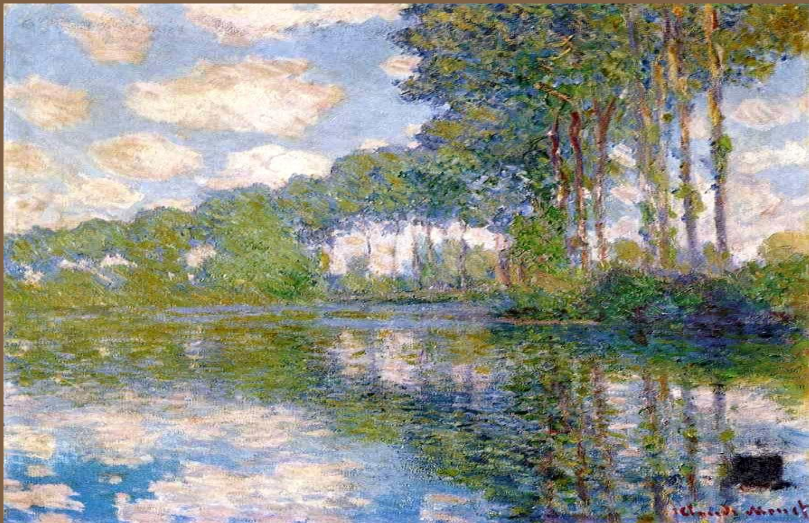
Клод Моне «Тополя»