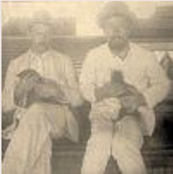
Возвращение с Сахалина. А.П.Чехов на пароме с М.И.Глинкой.