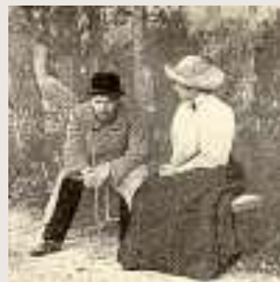
Чехов и Д.М.Мусина-Пушкина В Мелихово в 1897 году.