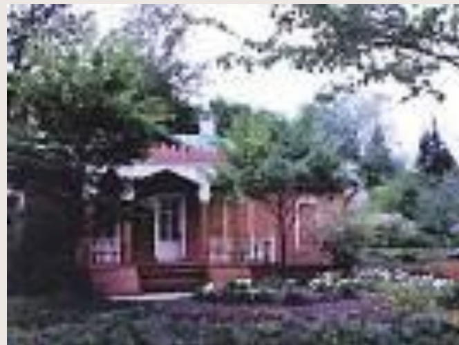
Музей-усадьба Антона Павловича Чехова В Мелихово.