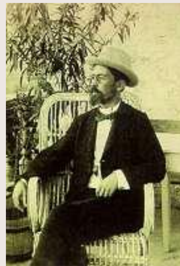
А.П.Чехов в Ялте.