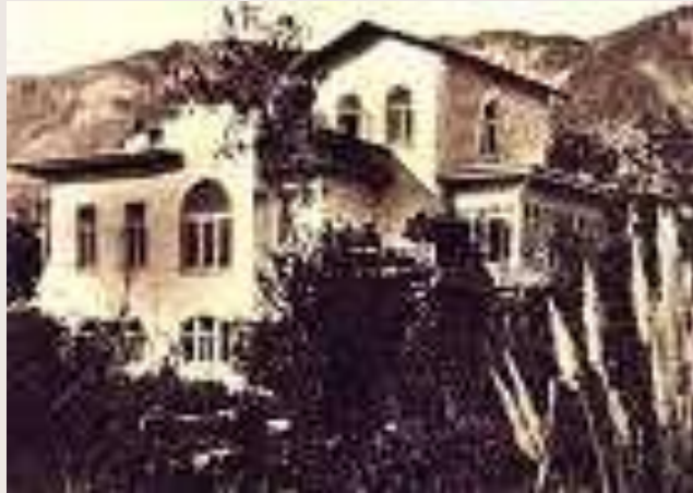
Ялтинский дом-музей Антона Павловича Чехова.