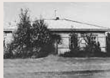
Дом-музей Антона Павловича Чехова на Сахалине.