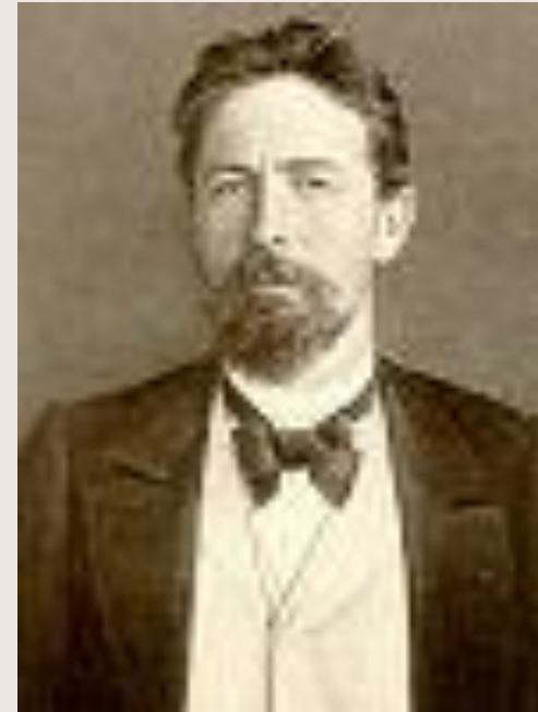
Чехов 1900 год.