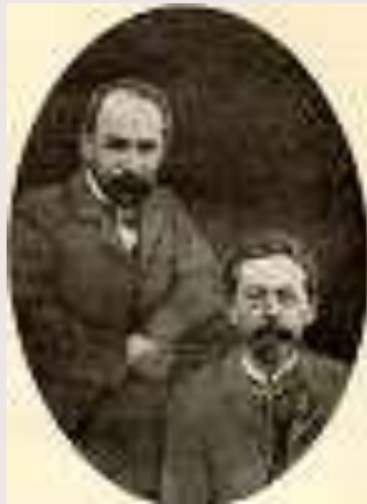
Чехов с Россолимо 1903 год