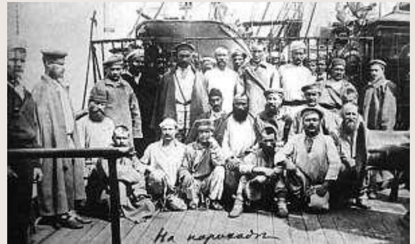
Чехов путешествует по Сахалину на пароходе.