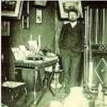
Ялтинский кабинет Антона Павловича.