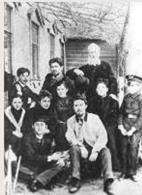
А.П.Чехов на Сахалине.