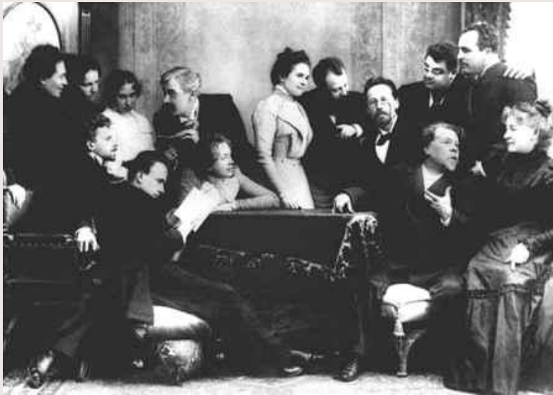
Чехов с артистами МХАТа.