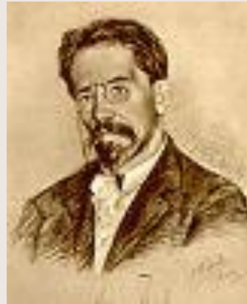
Чехов 1904 год.