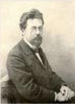
Чехов 1902 год.