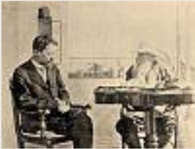
Чехов со Л.Н.Толстым 1901 год.