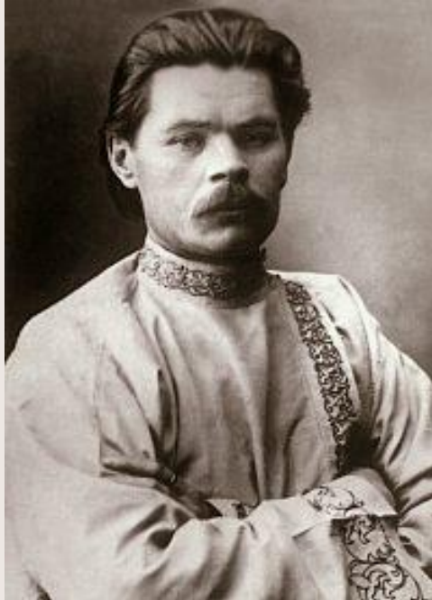
Алексей Максимович Горький