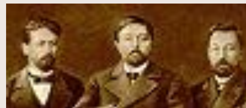
Чехов , Мамин-Сибиряк и И.Н.Потапенко в 1896 году.