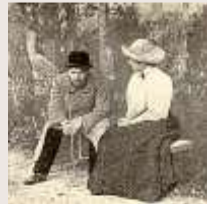
Чехов и Д.М.Мусина-Пушкина В Мелихово в 1897 году.