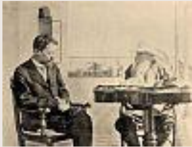
Чехов со Л.Н.Толстым 1901 год.