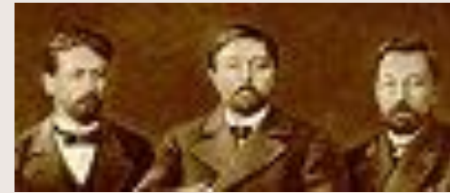
Чехов , Мамин-Сибиряк и И.Н.Потапенко в 1896 году.