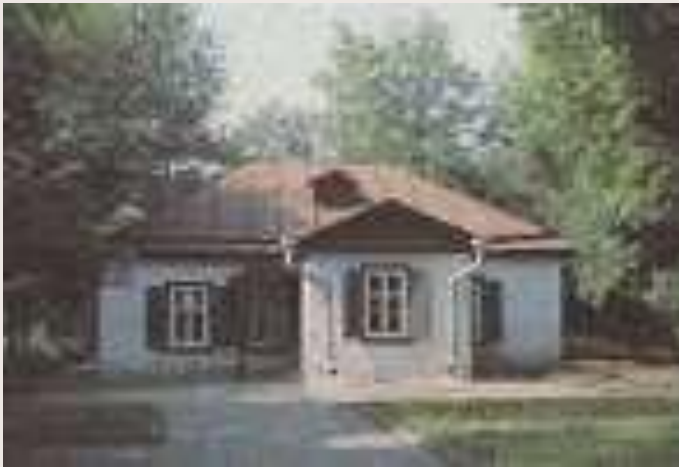
Дом-музей Чехова в Мелихово.