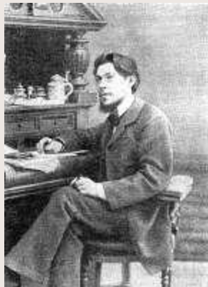
Старший брат Антона Чехова, литератор;