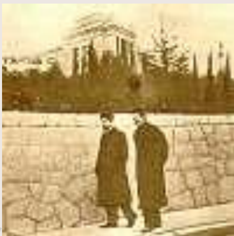
Чехов и М.Горький в Ялте. 1900 год.