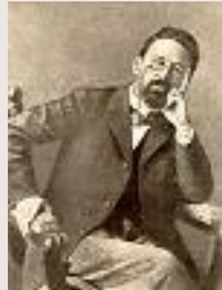
А.П.Чехов в 1891 году.