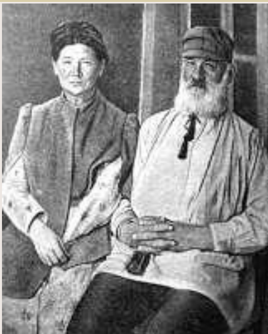
Родители А.П.Чехова в Мелихово.