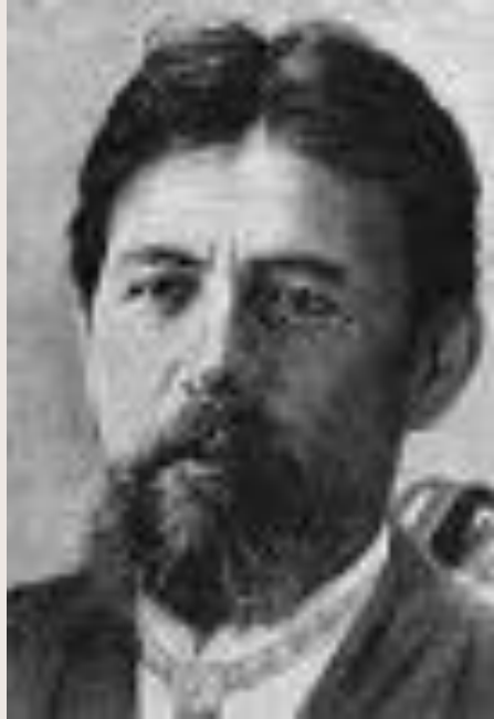
Последнее прижизненное фото Антон Павловича Чехова. 1904 год