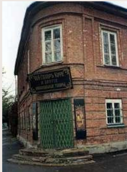
Дом-музей Чехова в Таганроге