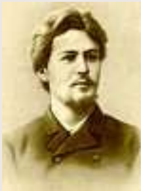
Чехов в 1885 году.