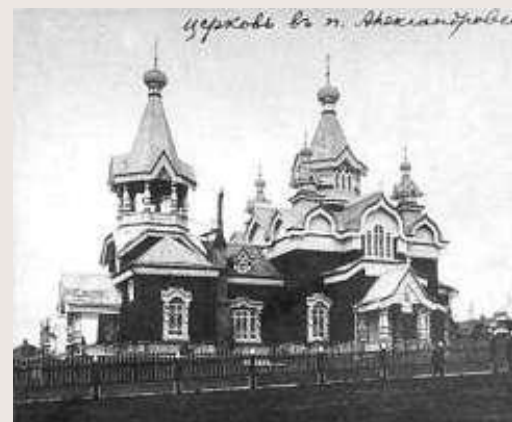
Церковь в пос. Александровском на Сахалине