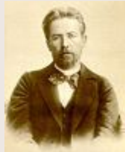
Чехов 1897 год, Петербург.