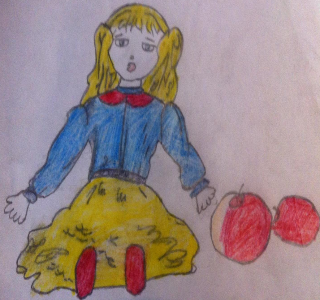
Иллюстрация Кристины Самохвал

«У Сони была большая кукла, с ярко раскрашенным лицом и роскошным лицом и роскошными льняными волосами ,подарок покойной матери .»