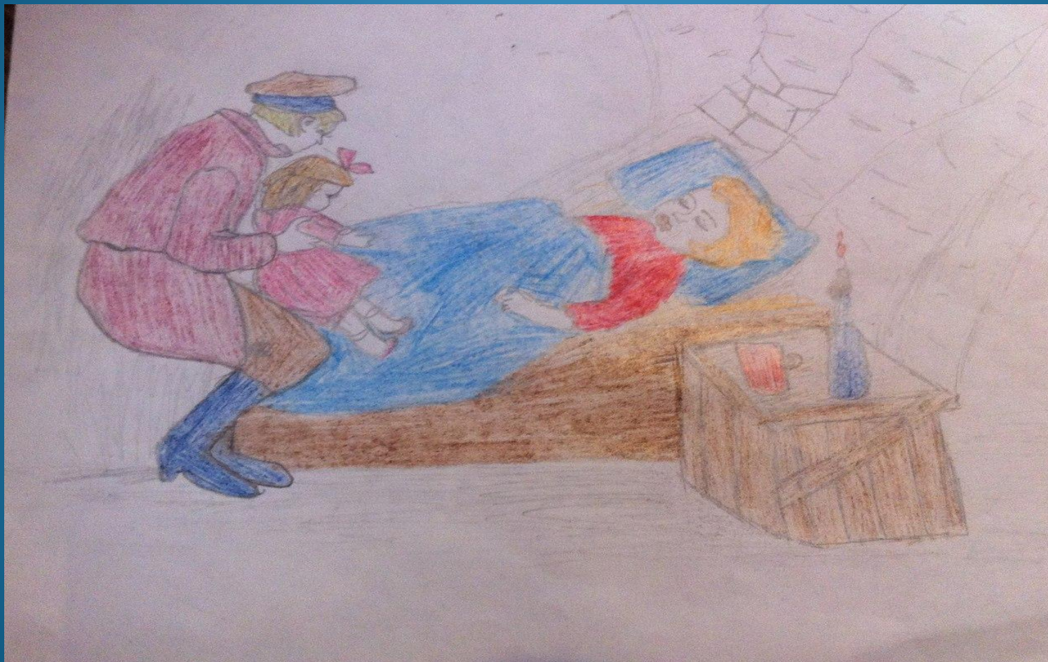
Иллюстрация Межецкой Дианы

«Я тотчас же с испугом положил куклу на место.»