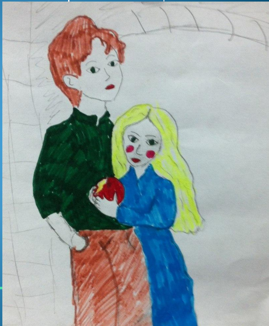
Иллюстрация Корен Арины

«Вынув из кармана два яблока, одно из них я дал Валеку, другое протянул девочке. Но она скрыла своё лицо прижавшись к Валеку.»