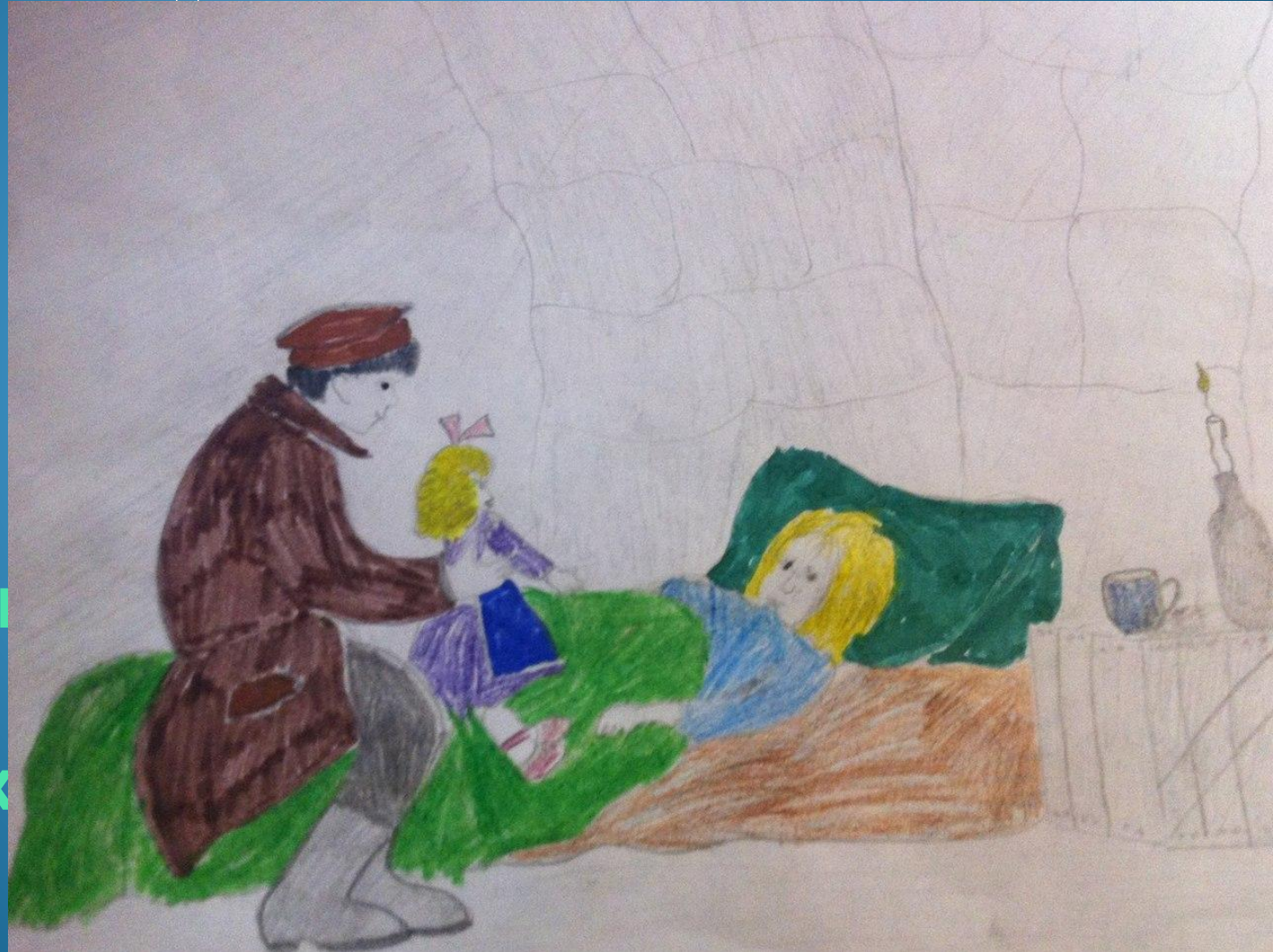
Иллюстрация я Дубровских Натальи

«Маруся опять слегла ,и ей стало ещё хуже ; лицо её горело странным румянцем ,белокурые волосы раскидались по подушке ; она никого не узнавала. Как только я вынул куклу из рук лежащей в забытьи девочки ,она открыла глаза, посмотрела перед собой смутным взглядом ...»