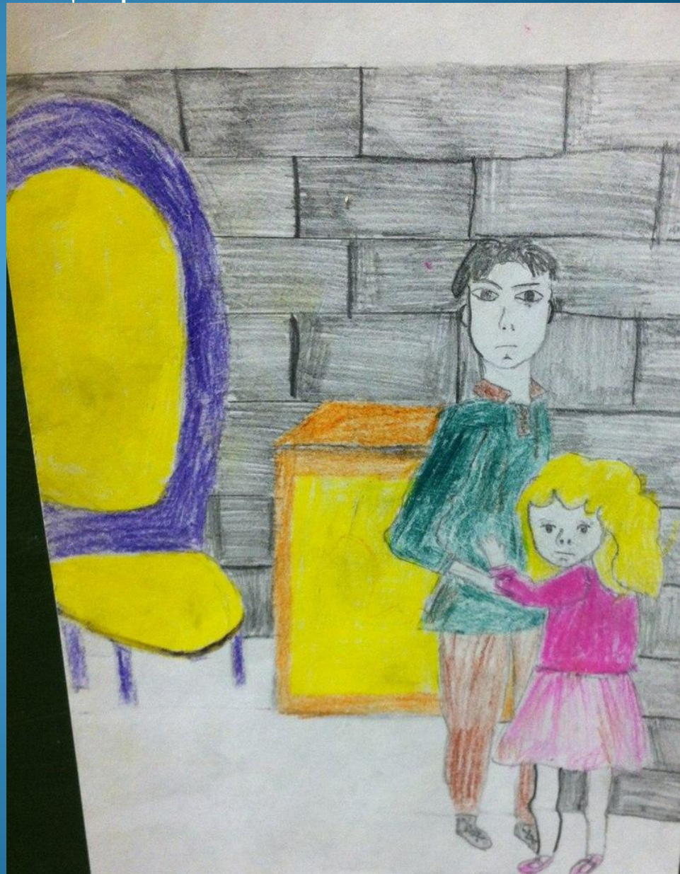
Иллюстрация Давыдовой Варвары

«...но всё же , увидев его, я сильно ободрился. Я ободрился ещё более , когда из-под того же престола ,или ,вернее, из люка в полу часовни, сзади мальчика показалось ещё грязное личико ...»