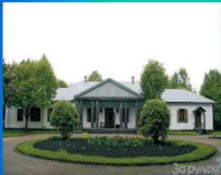
В наше время