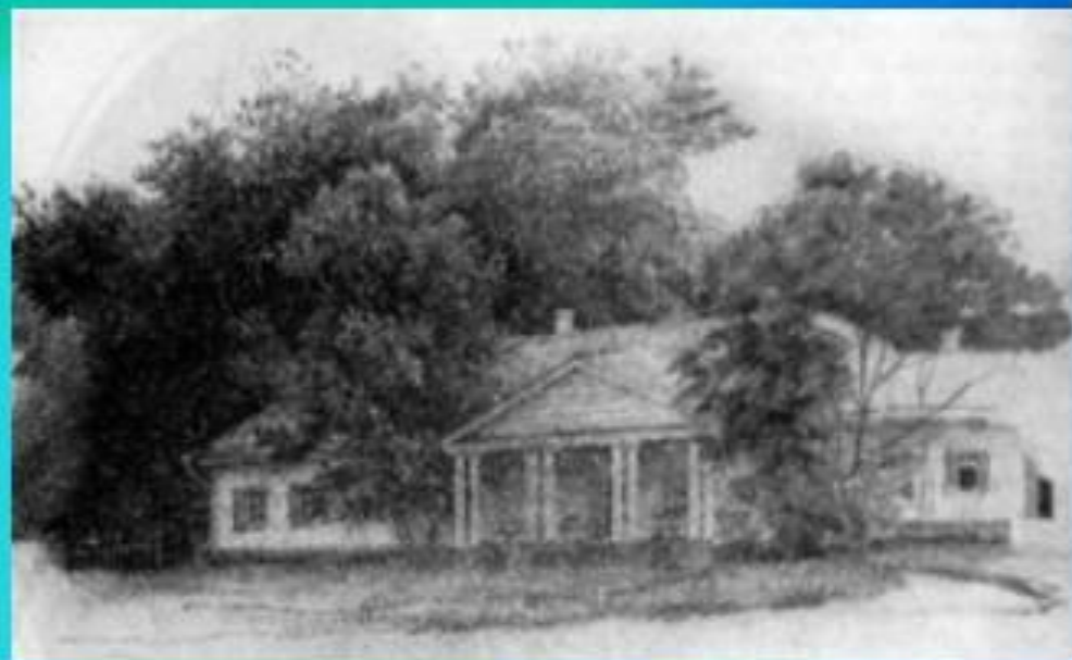
Во времена Гоголя