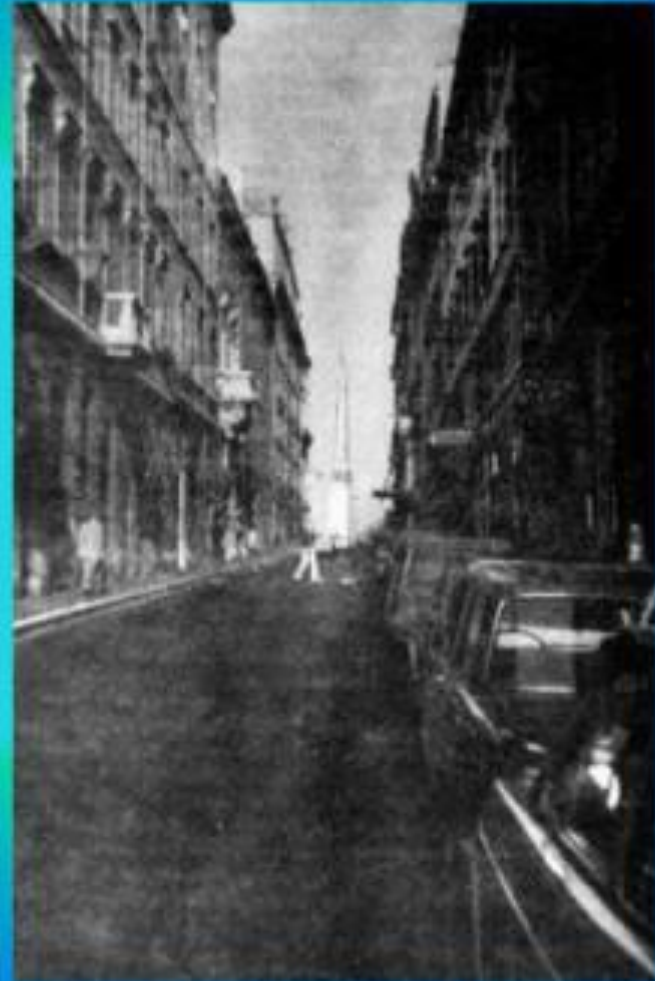
В этом доме, находящемся на улице в Via Sistina, Гоголь прожил 6 лет.

Годы жизни в Риме — это годы писания «Мертвых душ», писания и переписывания, перебеливания, выстраивания одиннадцати глав первого тома и начало «строительства» второго тома.