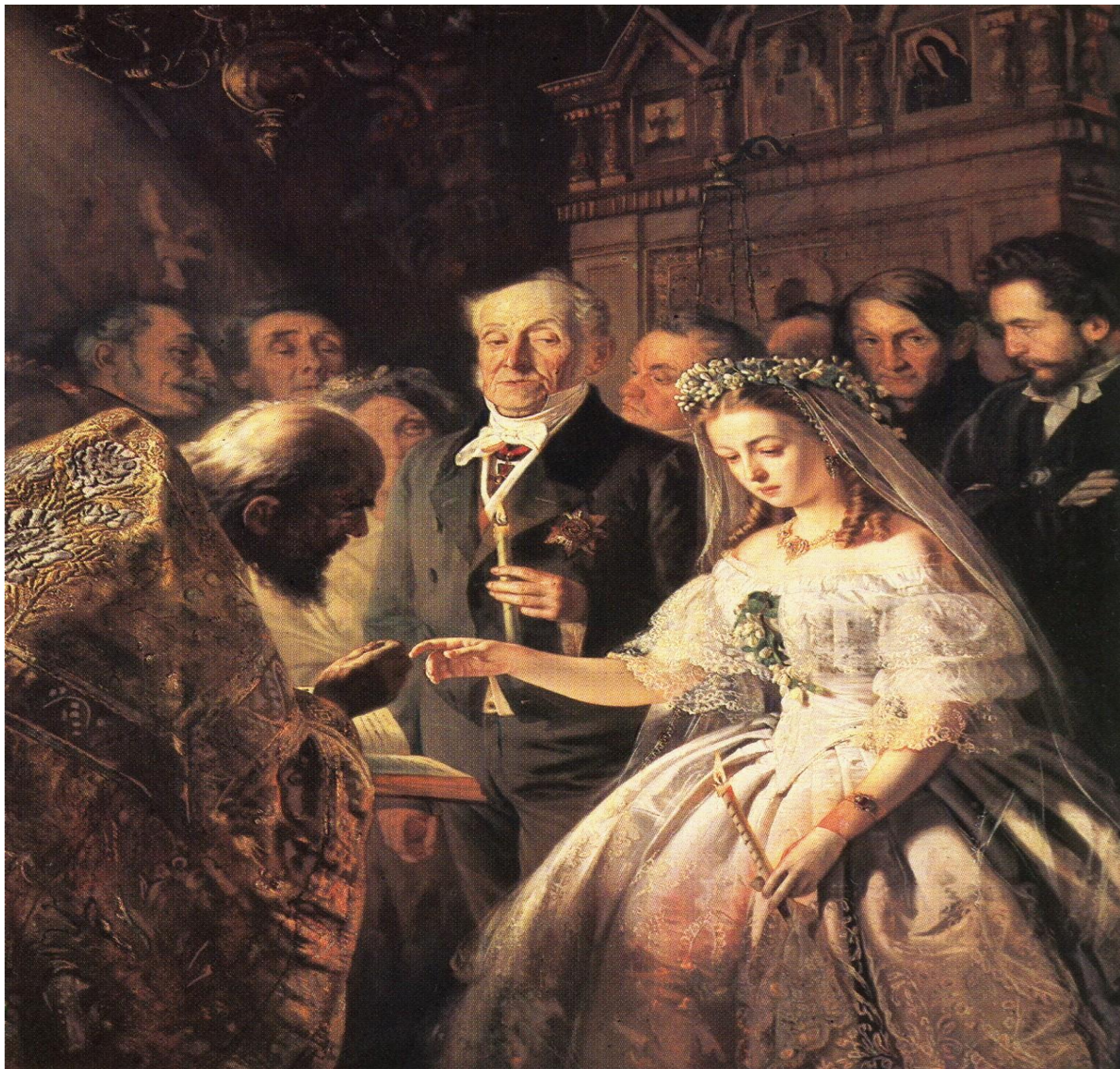
В.В. Пукирёв «Неравный брак» (1862 г.)