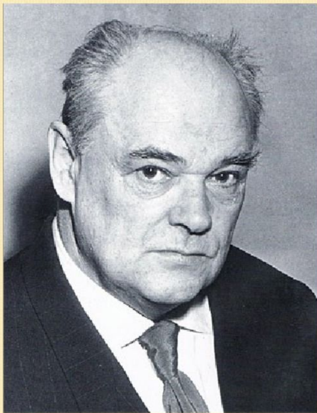
Евгений Иванович Чарушин (1901 - 1965)