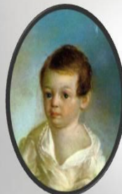
Пушкин - ребенок. Художник Ксавье де Местр. 1801-1802 гг.

Пушкин помнил себя с 4 лет. Он несколько раз рассказывал о том, как однажды на прогулке заметил как колышется земля и дрожат колонны, а последнее землетрясение в Москве было зафиксировано как раз в 1803 году. И, кстати, примерно, в то же время произошла первая встреча Пушкина с императором — маленький Саша чуть было не попал под копыта коня Александра I, который тоже выехал на прогулку.