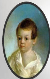
Пушкин - ребенок. Художник Ксавье де Местр. 1801-1802 гг.

Пушкин помнил себя с 4 лет. Он несколько раз рассказывал о том, как однажды на прогулке заметил как колышется земля и дрожат колонны, а последнее землетрясение в Москве было зафиксировано как раз в 1803 году. И, кстати, примерно, в то же время произошла первая встреча Пушкина с императором — маленький Саша чуть было не попал под копыта коня Александра I, который тоже выехал на прогулку.